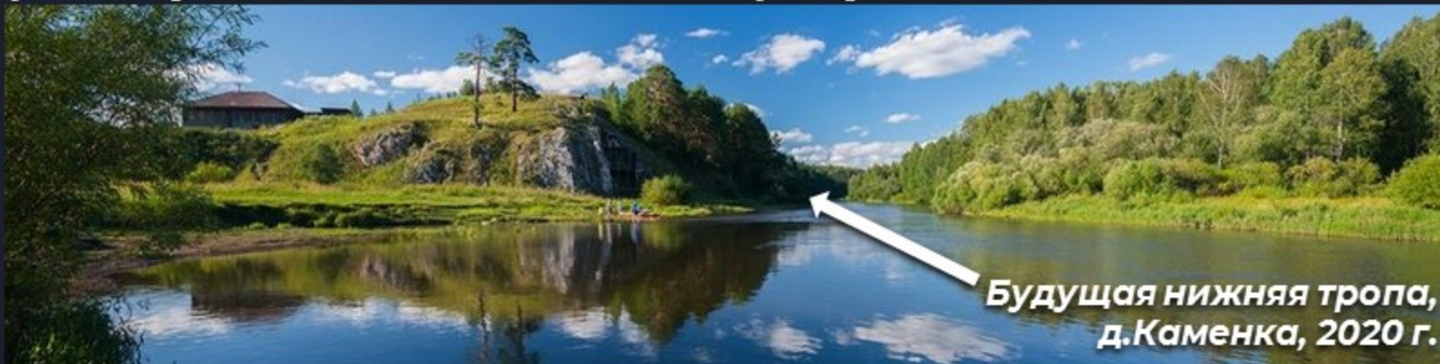
Будущая нижняя тропа, д.Каменка, 2020 г.

Обустроить километровую территорию вдоль реки Чусовой от Каменки в сторону Нижнего села: