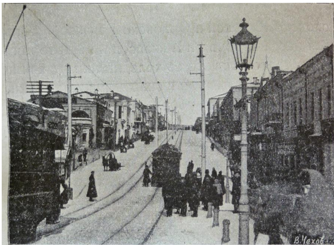
Орель. Болховская улица. (Къ стр. 12.)

В истории формирования архитектурного образа Орла и особенно Болховской улицы сыграл большую роль стиль классицизм.