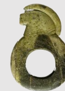
Курчатовский краеведческий музей http://kgkm.kursk-museum.ru