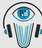
Курская библиотека слепых имени В.С. Алехина blindlibkursk.ru/ru