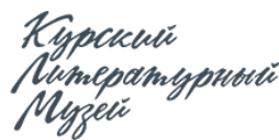
Курский литературный музей https://литературный-музей.рф