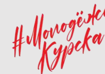
Управление молодежной политики, физической культуры и спорта города Курска vk.com/molodezhkurska