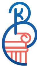
Волонтеры культуры волонтерыкультуры.рф