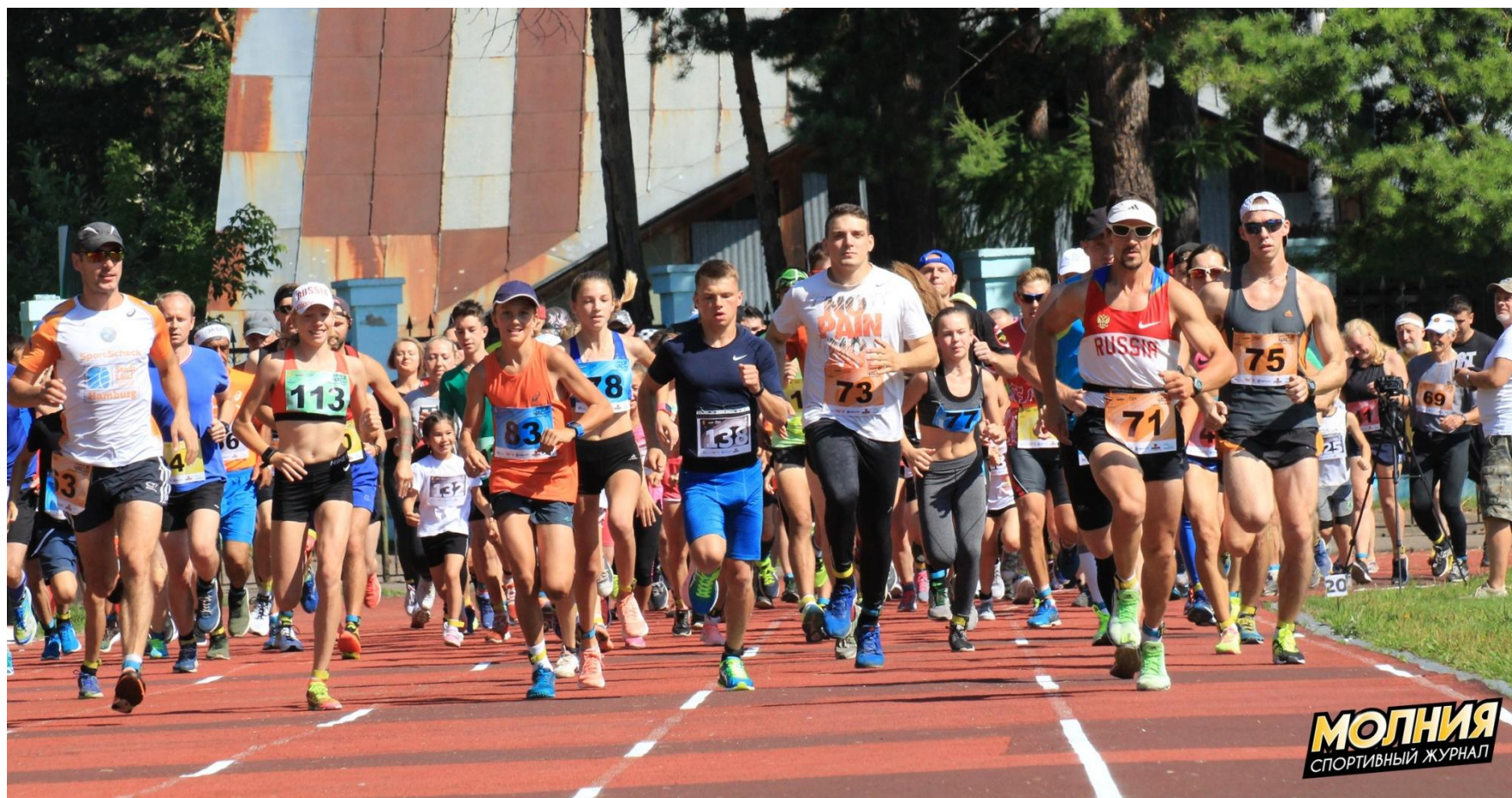
ФОТО И ВИДЕО РЕПОРТАЖИ