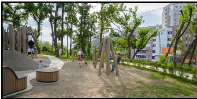
Нагорный парк во Владивостоке

Основная идея плейсмейкинга заключается в том, что если усилия общества будут направлены на улучшение общественных пространств, то это сразу же повысит качество жизни всех членов общества. Концепция подразумевает, что общественные пространства города принадлежат его жителям – если не юридически, то, по крайней мере, психологически.