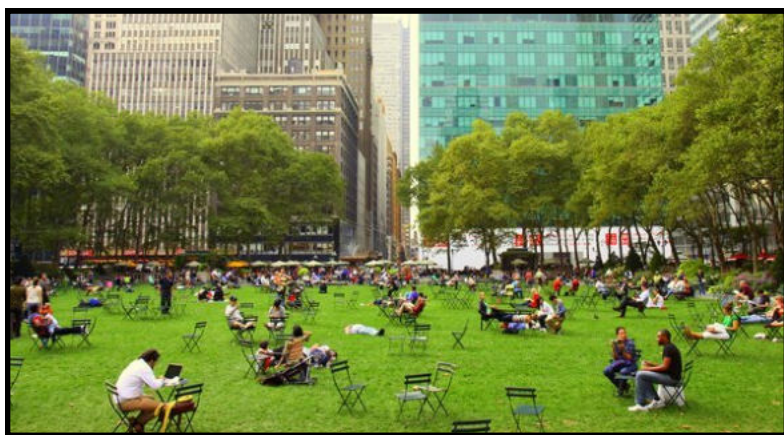
Брайант-парк на Манхэттене

Например, в Нью-Йорке понимают, что для создания уютного общественного места достаточно самого малого. Так, Брайант-парк, расположенный рядом с библиотекой, оборудовали стульями, чтобы в солнечную погоду люди могли выходить из здания и читать книги на свежем воздухе, разговаривать и общаться. В близлежащих киосках можно купить кофе и булочки. Рядом также находится шахматный клуб, где можно арендовать шахматы и играть в них в парке. При этом хорошо всем – и владельцам киосков, и библиотеке, и шахматному клубу, и людям, которые здесь отдыхают.