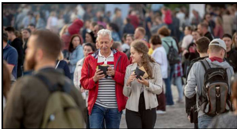
Городской пикник Kaliningrad Street Food

Термин «плейсмейкинг» появился в 1970-х годах в среде ландшафтных архитекторов и градостроителей. Это понятие обозначало процесс создания площадей, парков, улиц и набережных, которые бы привлекали людей своей интересностью и удобством.