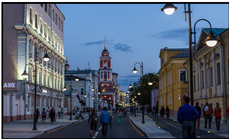
Улица Пятницкая в Москве