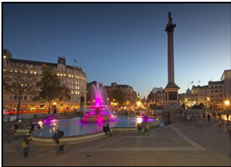
Трафальгарская площадь в Лондоне

В Лондоне земля во многих районах принадлежит старым аристократическим семьям – Кадоганам, Гровенорам, Портманам и другим. Землей распоряжаются компании, принадлежащие этим семьям. И плейсмейкингом тоже, соответственно, нередко занимаются эти компании. Так, в ближайшие пять лет компания Portman, управляющая недвижимостью Портманов, планирует потратить на реставрацию своих владений 150 млн фунтов стерлингов, De Walden Уолденских Говардов инвестирует 200 млн, Cadogan Estate Кадоганов только на обустройство Слоун-стрит потратит 25 млн.