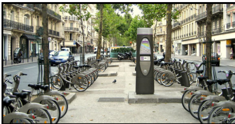
Многие места в Париже оборудованы стоянками Vélib

Городское пространство постоянно продолжает преобразовываться для удобства людей. Например, часть площади Республики была отдана в распоряжение пешеходов. Власти вдохновились идеей аналогичного переустройства Трафальгарской площади в Лондоне.