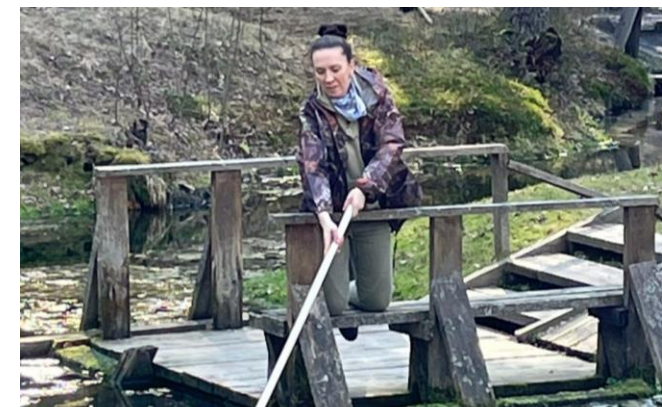
Расчистка пруда у охотничьего домика

После пересыхания родник Совы долгое время был заброшен и зарос густым кустарником и травой. Совсем недавно в роднике вновь забили ключи. Было принято решение расчистить родник для доступа гостей Национального парка. Волонтерская команда вырубилa сухостой, убрала мусор.