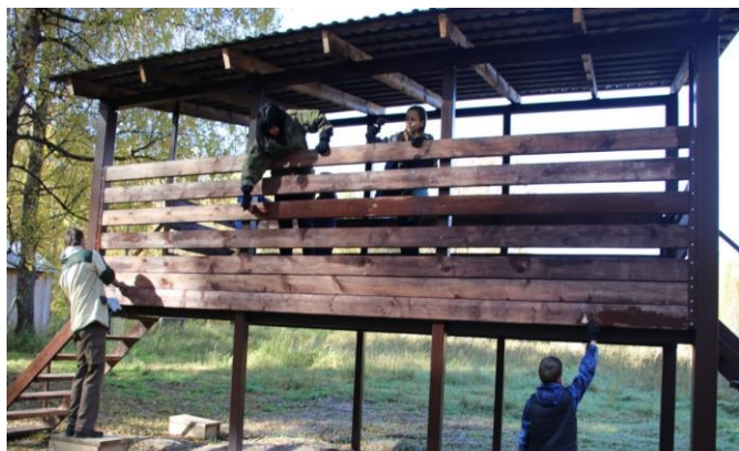
Обустройство подкормочных станций для зубров

Проект «В царстве водяной лилии» включает в себя регулярную и последовательную волонтерскую помощь команде Национального парка. Менее, чем за год, волонтеры благоустроили 5 природных территорий.