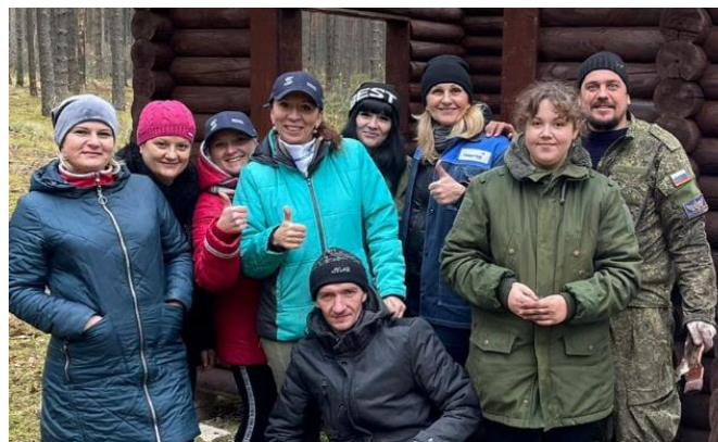
Обустройство мест отдыха для посетителей Парка

Силами волонтеров были построены деревянные смотровые площадки и кормушки на подкормочной станции, где в зимнее время (при отсутствии в достаточном количестве пищи) происходит подкормка популяции зубров, обитающих на территории Национального парка.