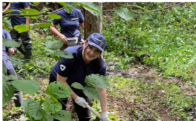
Уборка природного родника Сова

Для прокладки тропы до пруда вырубili сухостой, убрали мусор, выровняли поверхность тропинки. По пути установили схему тропы, навигационные таблички-указатели. Затем на пруду с водяными лилиями возвели деревянный помост, на нем установили лавку и урны.