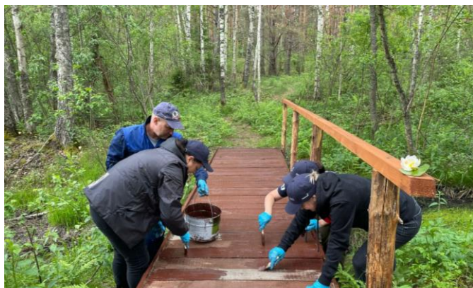
Обустройство новой экологической тропы Национального парка

Проект «В царстве водяной лилии» включает в себя регулярную и последовательную волонтерскую помощь команде Национального парка. Менее, чем за год, волонтеры благоустроили 5 природных территорий.