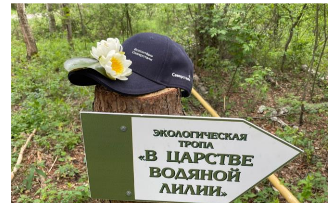
Обустройство новой экологической тропы Национального парка

Волонтеры установили крытые деревянные беседки в местах отдыха посетителей «Орловского полесья». В рамках проекта добровольцы пропитали специальным составом деревянные конструкции и убрали мусор на прилегающей территории.