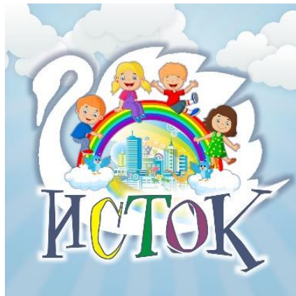
Центр дополнительного образования детей «Исток»