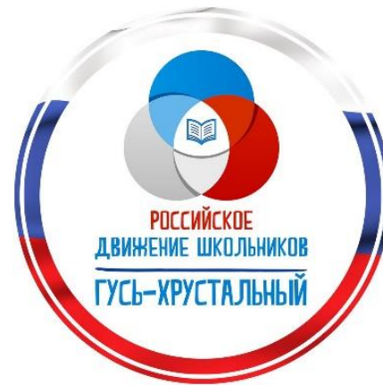
Российское движение школьников (местное отделение)