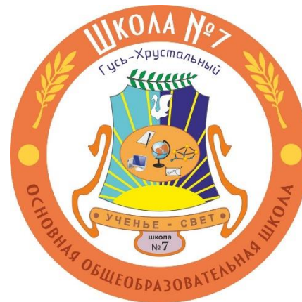
МБОУ «Основная общеобразовательная школа №7»