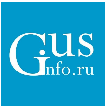
Интернет-портал города Гусь-Хрустальный