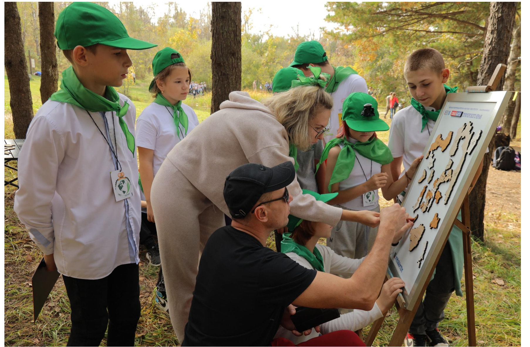
Первый межмуниципальный слёт юных краеведов в Дендропарке «Кедровое озеро» 02.10.2022г.