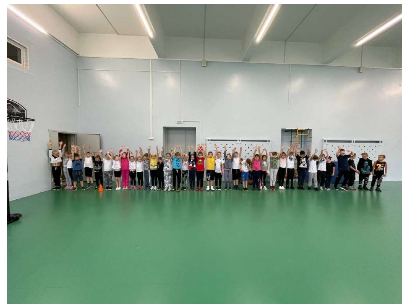
Спортивные мероприятия, эстафеты совместно с родителями