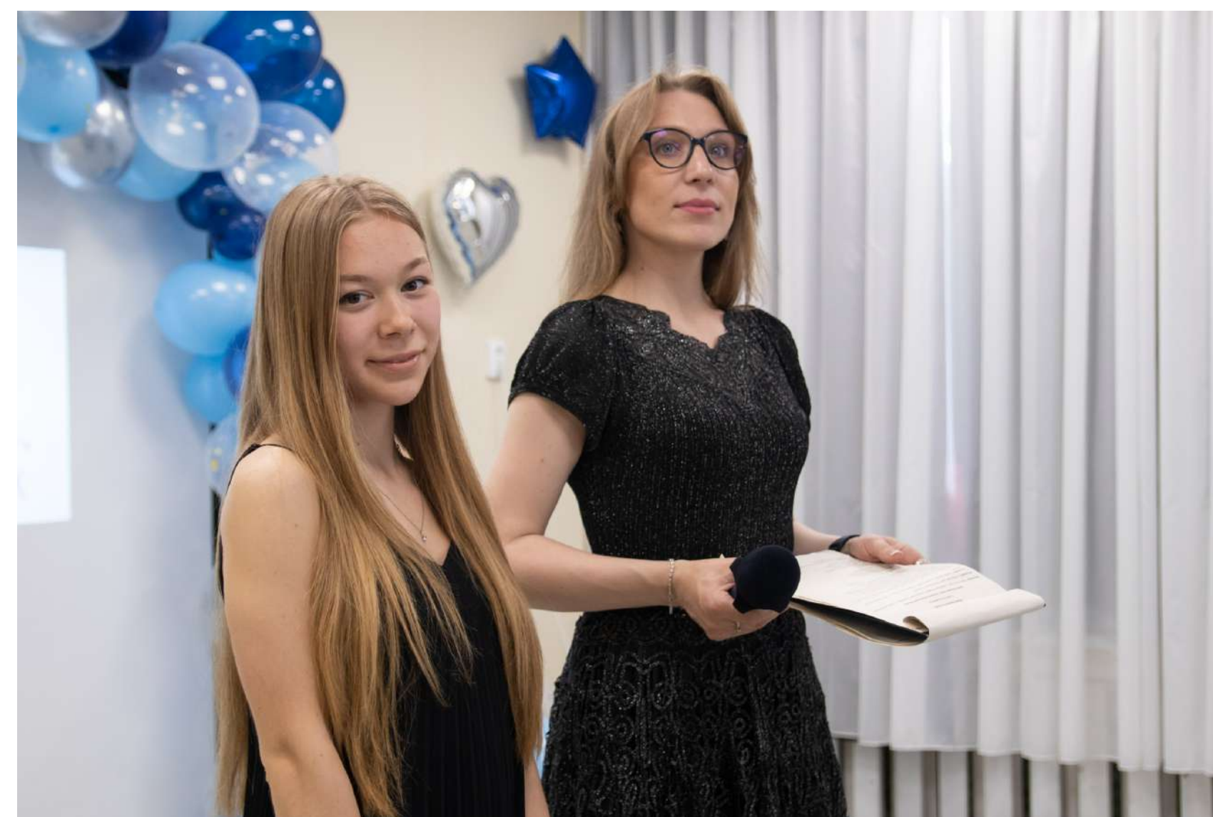
Концерт для детей с ОВЗ