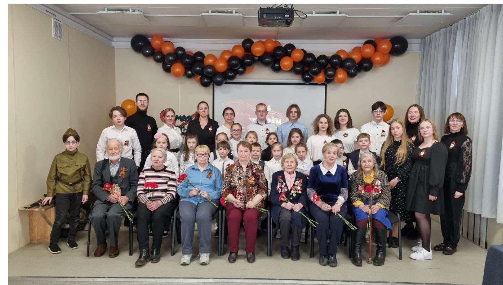
Благотворительный концерт для ветеранов ВОВ