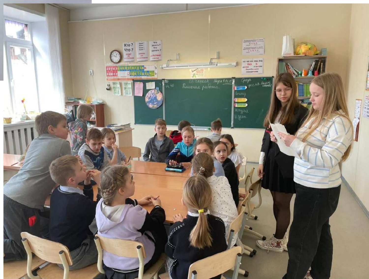
Цикл мероприятий ко дню космонавтики