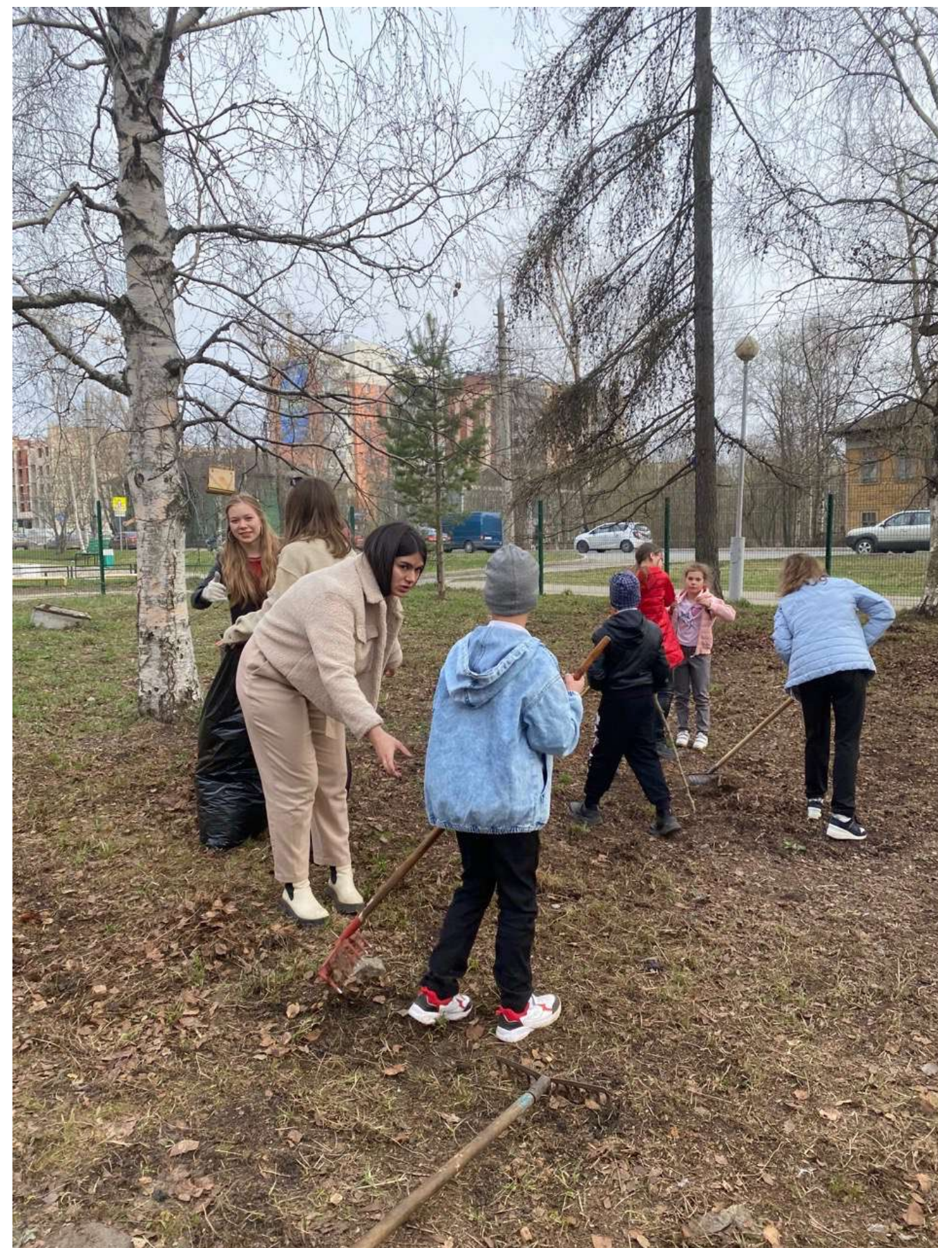
Регулярные субботники на территории школы и парков Архангельска