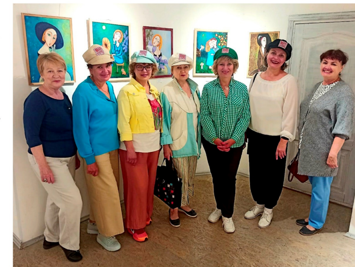
выступление танцевального коллектива 50+