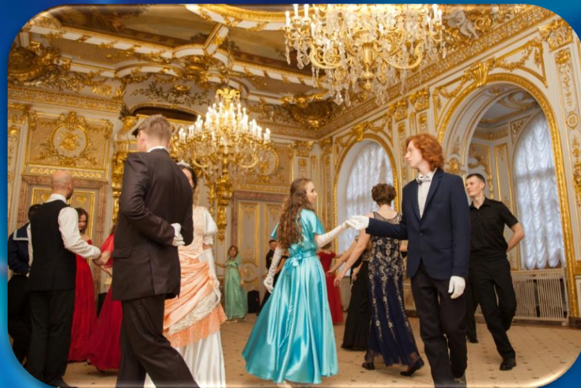
Особняк А.А. Половцова ( Белый зал) 2018-2019 год