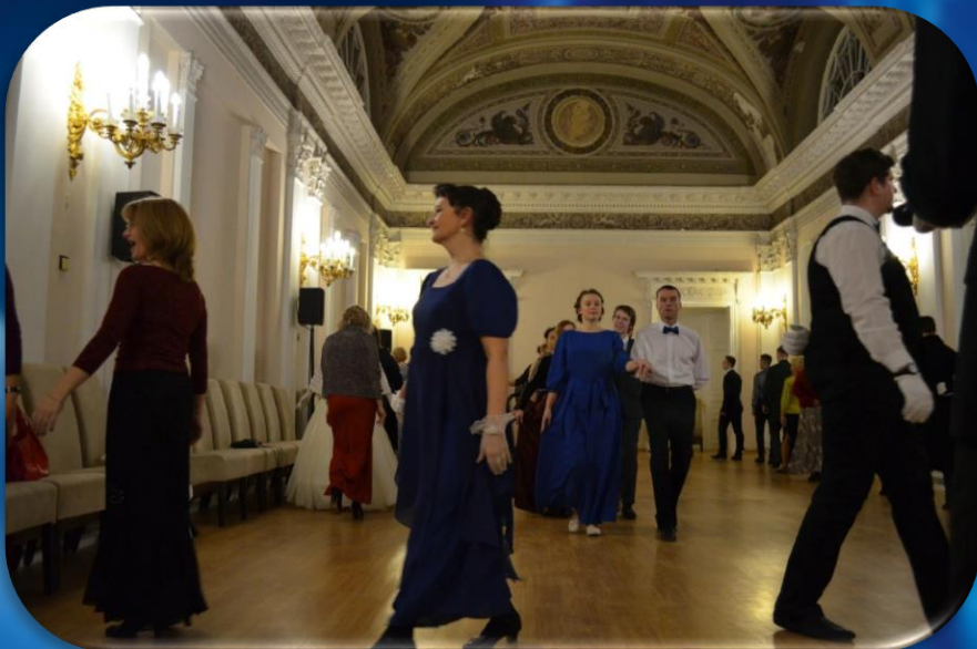
Особняк П.Н. Демидова 2017 год