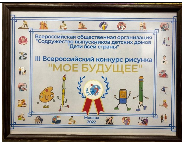
Внешний вид Таблички выставки (20 x 30 см)