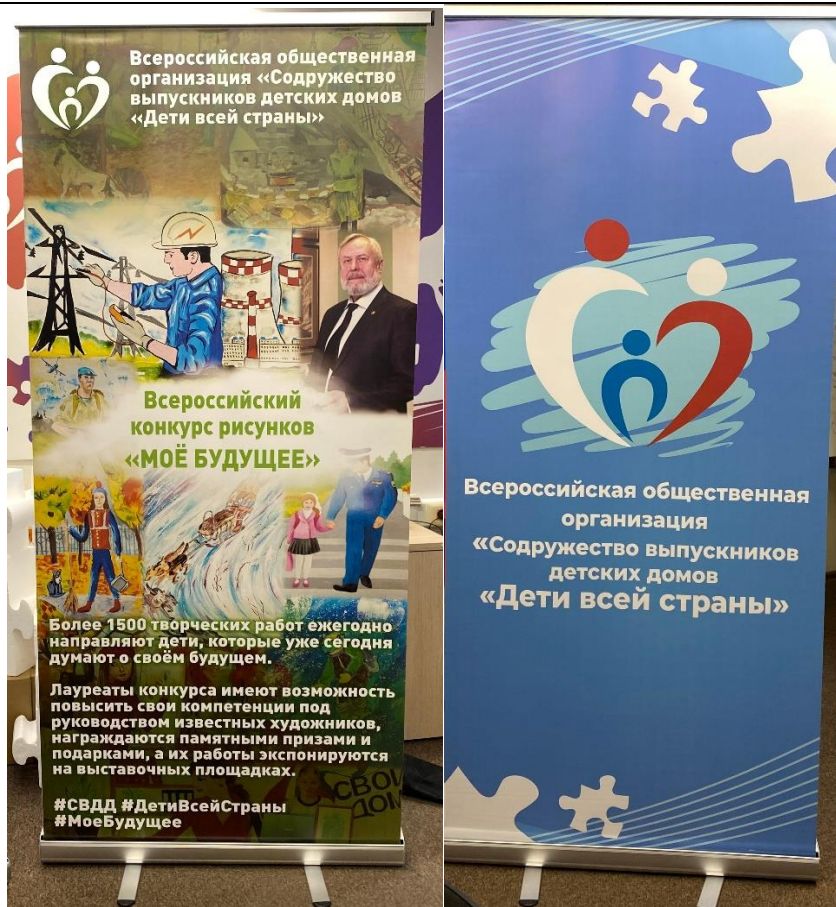
Внешний вид ролл-апов (2 штуки)