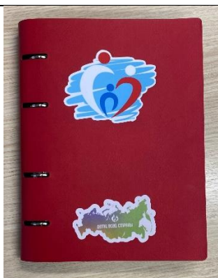
Книга отзывов (15 x 21 см)