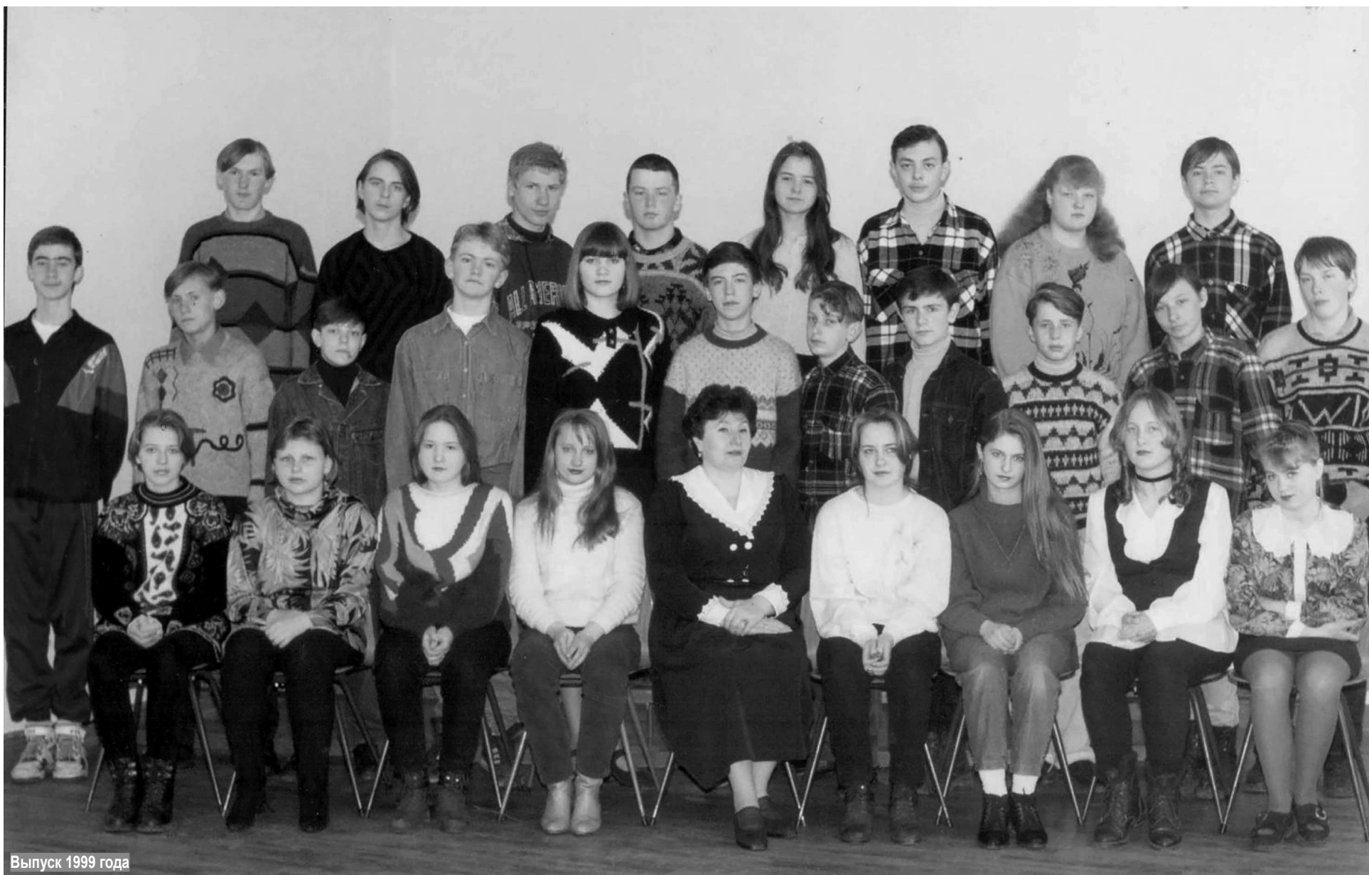
Выпуск 1999 года