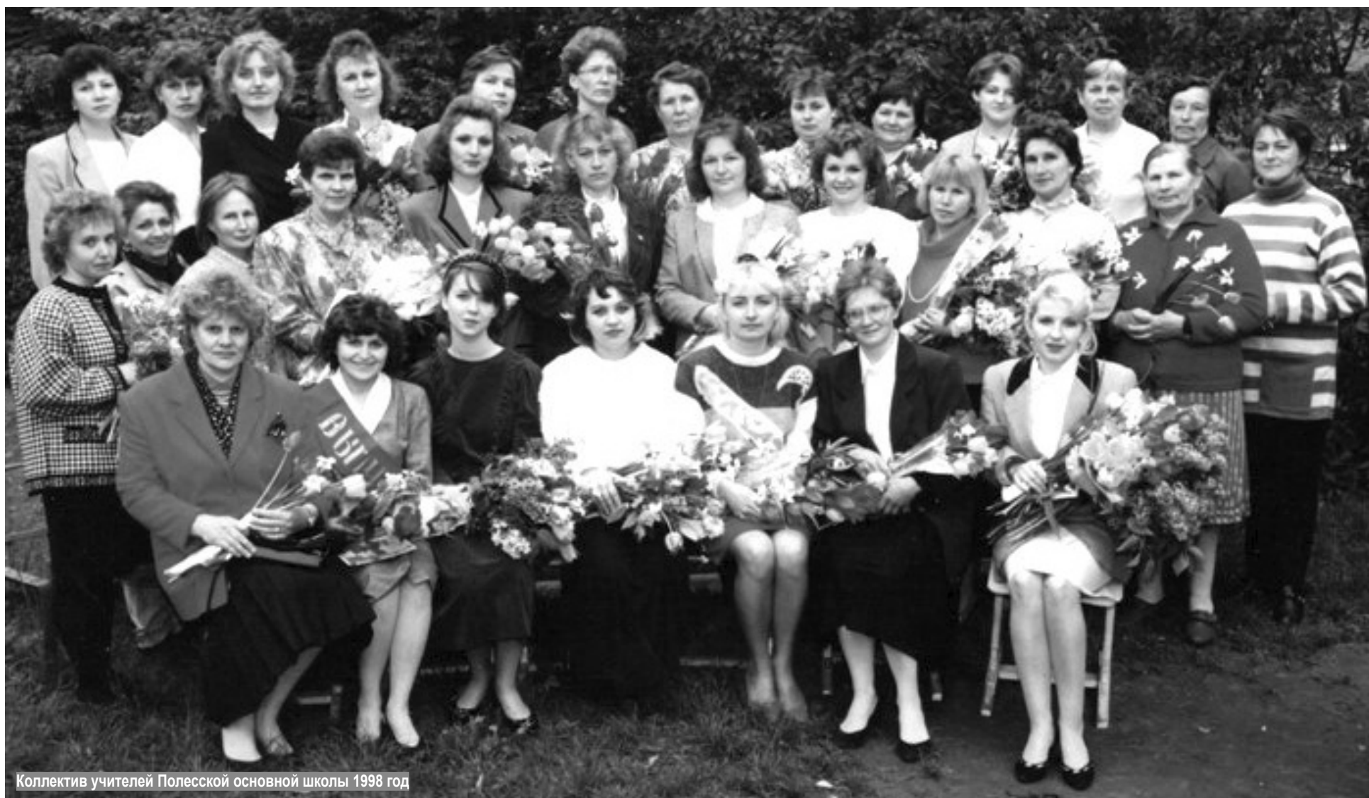
Коллектив учителей Полесской основной школы 1998 год