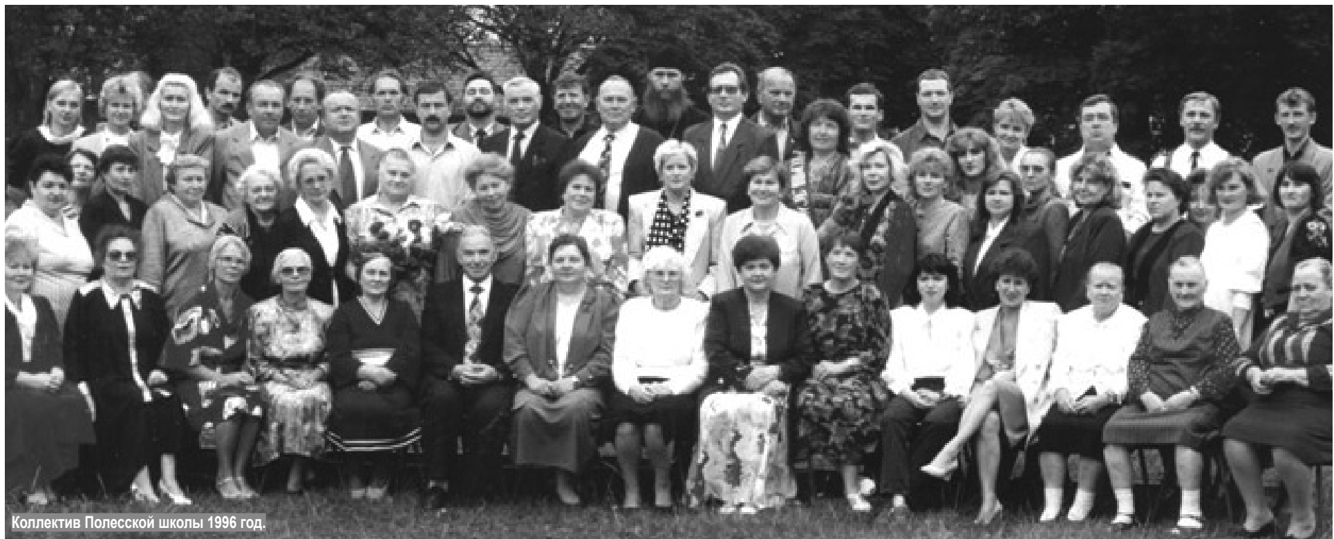
Коллектив Полесской школы 1996 год.