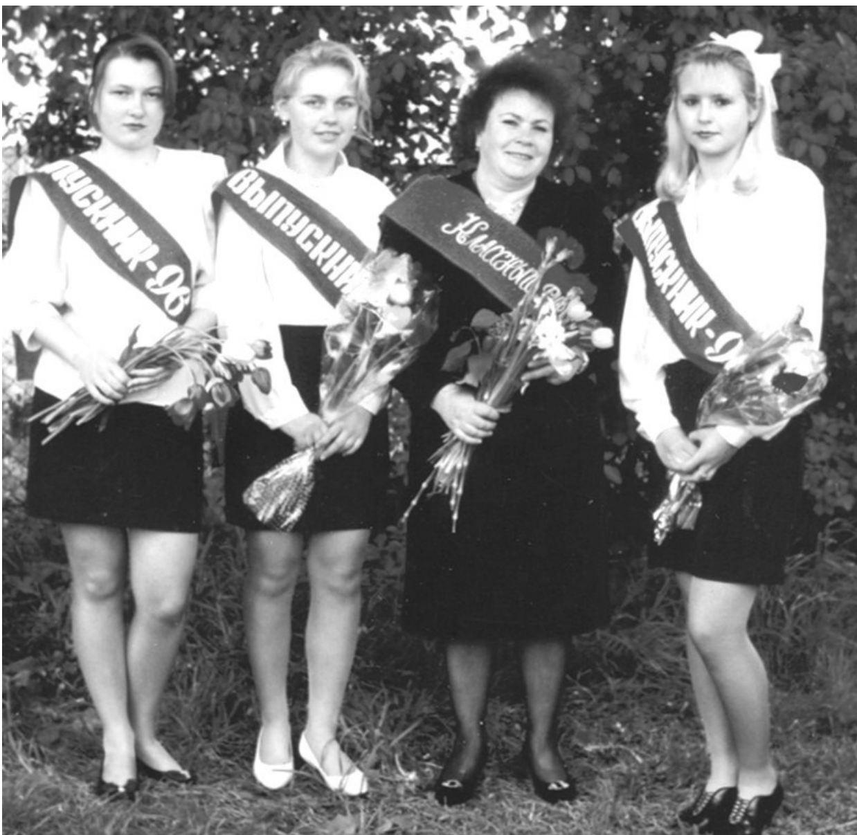
Выпускники 1996 г.