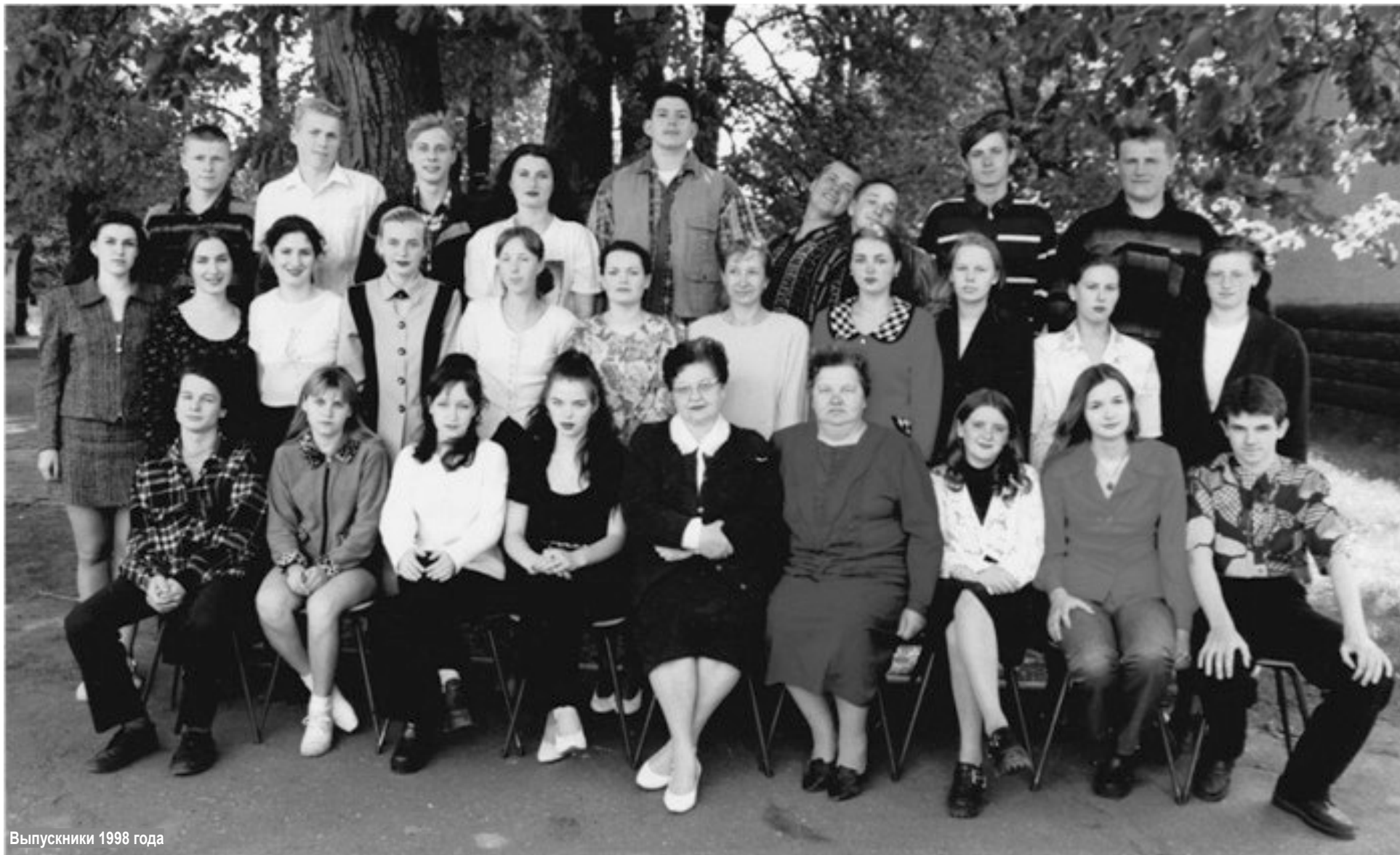
Выпускники 1998 года