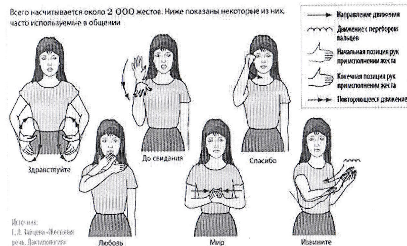
Рис. 2 Основные элементы языка жестов

Всего насчитывается около 2 000 жестов. Ниже показаны некоторые из них, часто используемые в общении