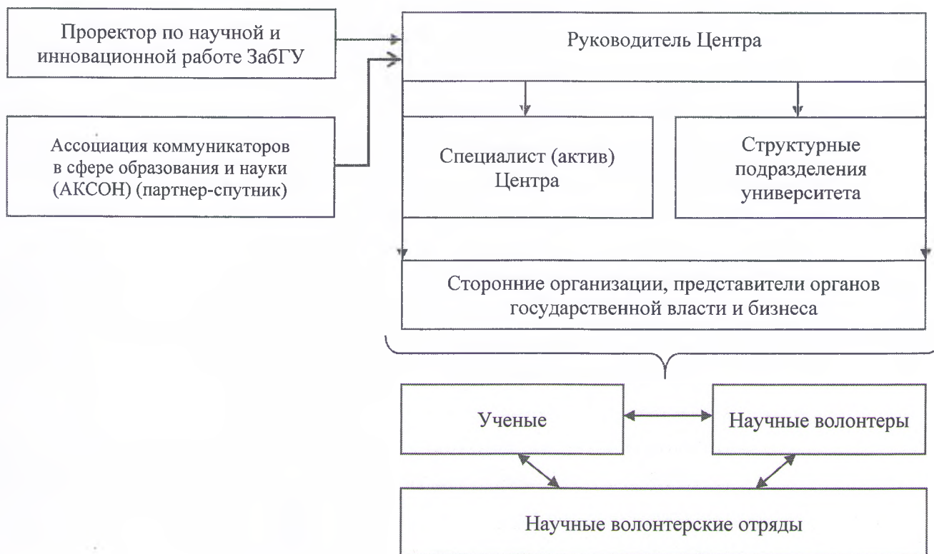
Схема 1. Организационная структура Забайкальского центра гражданской (волонтерской) науки

2.3. Руководитель Центра опирается в своей деятельности на волонтерский актив Центра (специалиста).