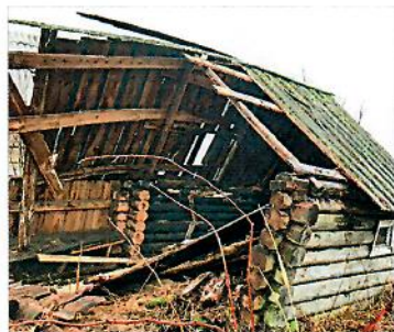
Жители посёлка Гремячий летом провели подворовый обход, и оказалось, что снести нужно не менее шестидесяти строений.