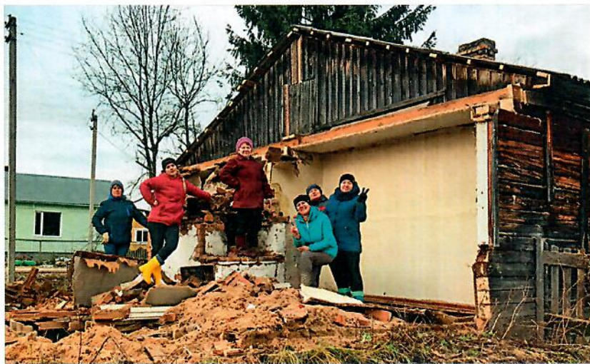
Участствуя в совместном разборе деревяшек, у людей появляется новое осмысленное дело, люди говорят, что у них появилась надежда на будущее.

Весной новая глава поселения организовала разбор тринадцати построек. Самый первый объект находился в центре посёлка. С этого родился новый проект, который тут же заявили на федеральный грант. Затем летом провели подворовый обход, и оказалось, что снести нужно не менее шестидесяти строений, причём не только муниципальных, но и частных. «У людей нет возможности сделать это самостоятельно, потому что для разбора дома нужна техника. Работа мани-