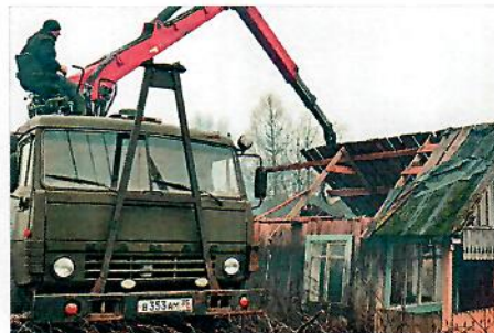
В средства гранта не входит оплата труда, но есть возможность оплатить аренду техники и стоимость горюче-смазочных материалов.

пюлятора стоит 2,5 тысячи рублей в час. Затем мусор нужно организованно вывезти на свалку», — говорит Ксения Гнездилова.