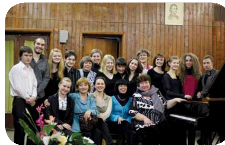
Со студентами, выпускниками и коллегами. Мурманский колледж искусств