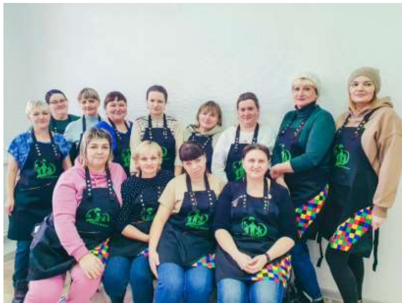
Технология «Школа ухода»

В 2022 году благополучателями проекта «Точка опоры» стало 200 человек, проекта «Санаторий на дому» – 2 человека, а проекта «Оптимальный патронаж» – 16 сотрудников организации, 156 получателей социальных услуг, 24 родственника маломобильных и лежачих людей.