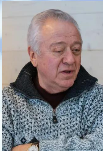
Григорий Ковалевский – Директор государственного камерного оркестра Virtuozы Москвы, меценат.