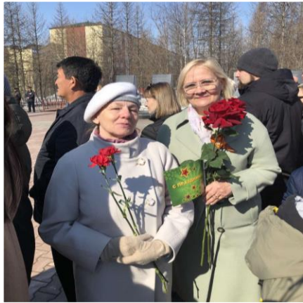
«ВОЛОНТЕРЫ СЕРЕБРЯНОГО ВОЗРАСТА»