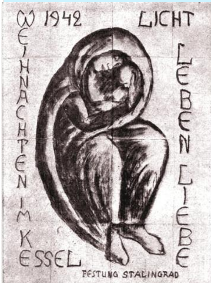
Рисунок немецкого военного врача Курта Ройбера, сделанного им в ночь с 24 на 25 декабря 1942 года

..Укутанная в черный плащ Богоматерь нежно держит на крепкой руке ребенка, склонившись над ним.