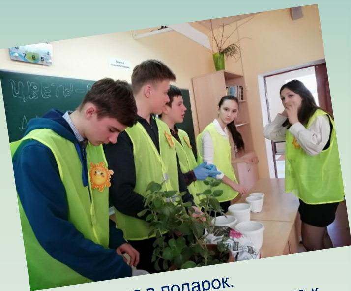
Растения в подарок. Приглашение на экоэкскурсию к цветникам школы