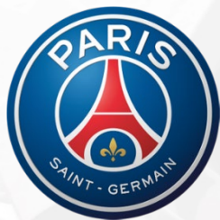
PARIS SAINT-GERMAIN FC