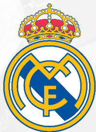
REAL MADRID CF