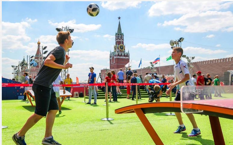
Парк футбола, Красная площадь