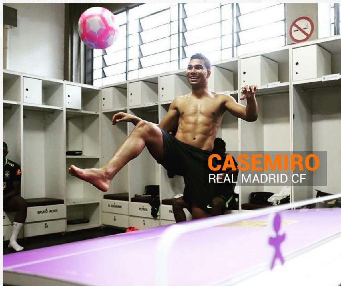
CASEMIRO REAL MADRID CF

БОЛЕЕ 40 ФУТБОЛЬНЫХ ГРАНДОВ ВЫБИРАЮТ ТЕКБОЛ