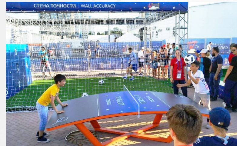
Зоны коммерческого дисплея, стадионы ЧМ-2018

ТЕКБОЛ УЖЕ ПОКОРИЛ МИР, ТЕПЕРЬ ПОКОРЯЕТ РОССИЮ