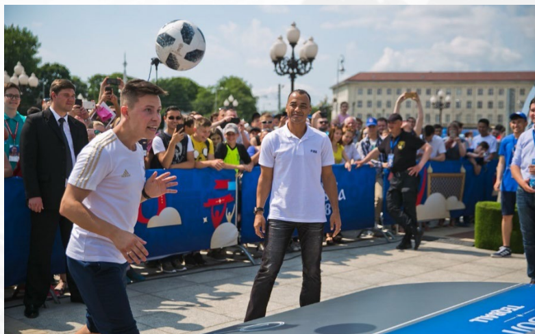
Парк футбола, 11 городов ЧМ-2018

Текбол стал хедлайнером развлечений для болельщиков на чемпионате мира по футболу FIFA 2018. Текборды можно было встретить в 7 официальных фанзонах FIFA, в Парке футбола на Красной площади, в мобильном Парке футбола, посетившем 11 городов-хозяев ЧМ-2018, а также на многочисленных неофициальных площадках мундиала.