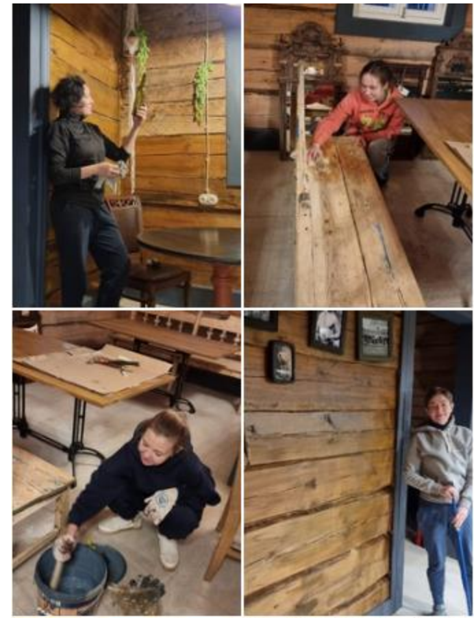
Волонтеры на восстановлении дома