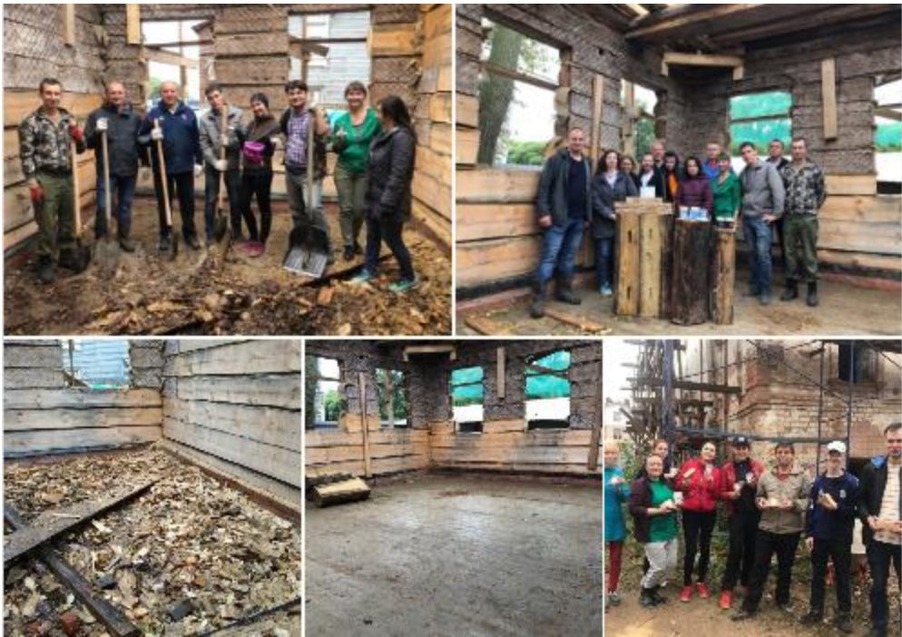
Волонтеры на восстановлении дома