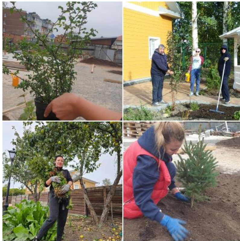
Волонтеры на проекте Травяной сад Заречного квартала