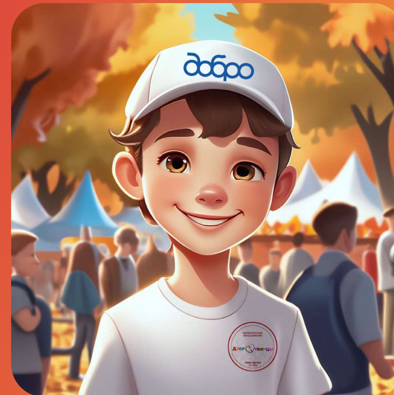
ВОЛОНТЕРЫ ОСЕННЕЙ ЯРМАРКИ