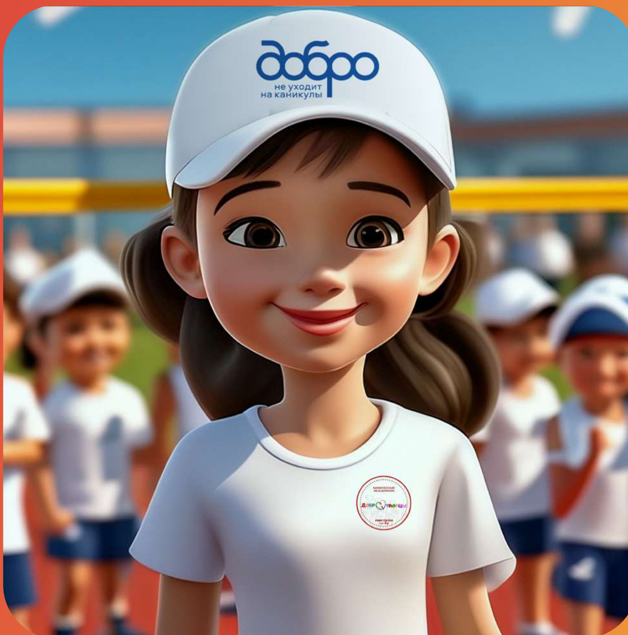
ВОЛОНТЕРЫ СПОРТИВНЫХ СОРЕВНОВАНИЙ