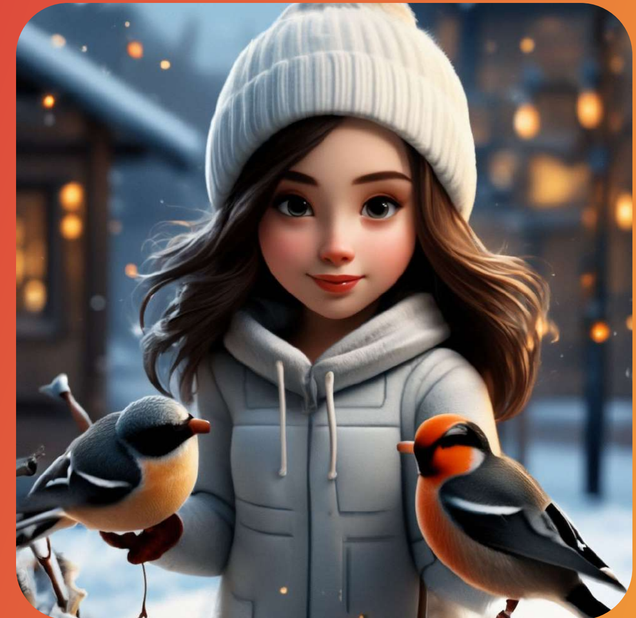
АКЦИЯ "ПОКОРМИТЕ ПТИЦ ЗИМОЙ"