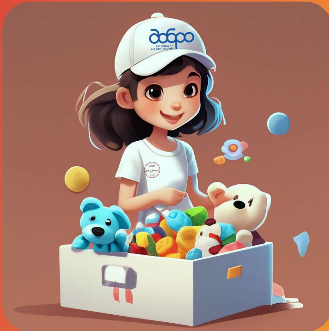
АКЦИЯ "КОРОБКА ХРАБРОСТИ"