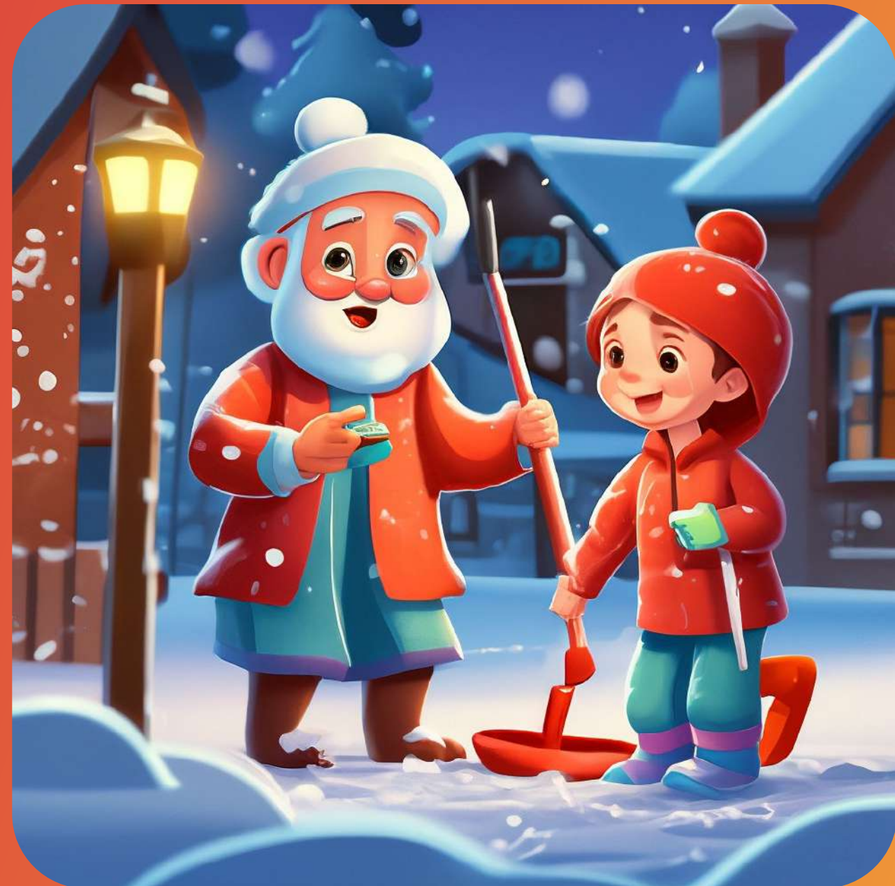
АКЦИЯ "СНЕЖНЫЙ ДЕСАНТ"