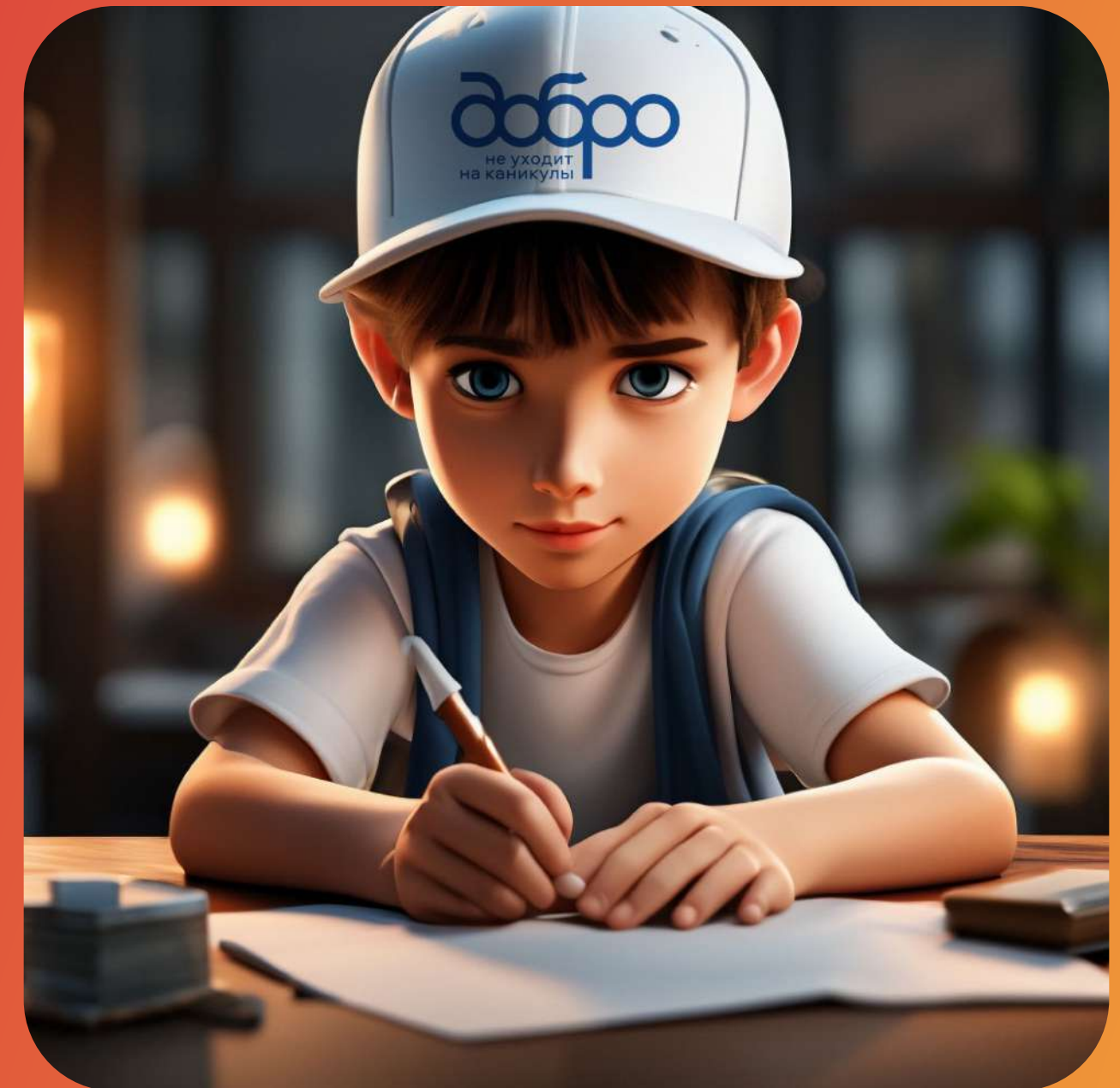
АКЦИЯ "ПИСЬМО СОЛДАТУ"