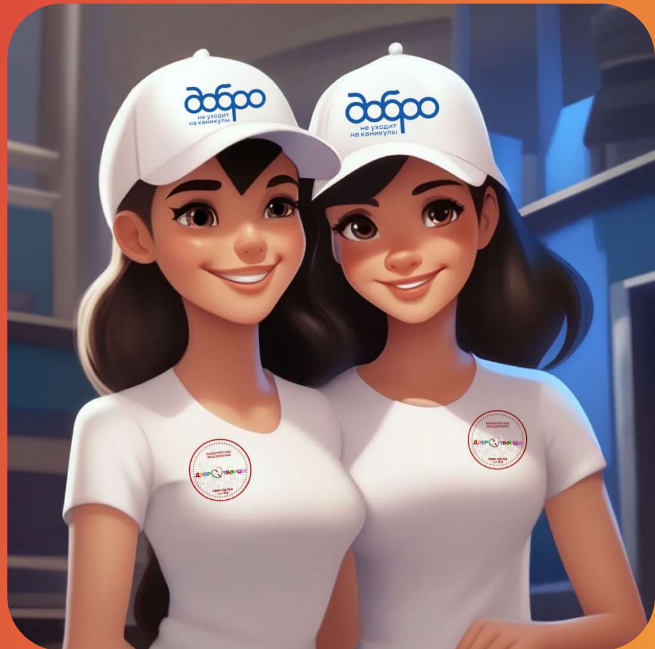
УРОКИ СОЦИАЛЬНОЙ АКТИВНОСТИ