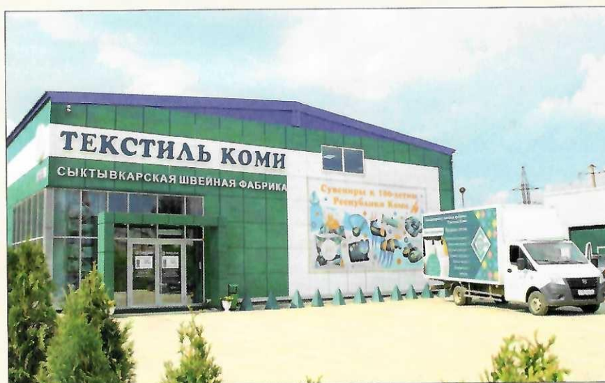
Сегодня компания «Текстиль Коми» обрела новый дом.

в размере 20000 рублей, смог доказать, что такой дорогой иск – это злоупотребление правообладателями своими правами. В результате суд снизил размер компенсации до 3300 рублей.