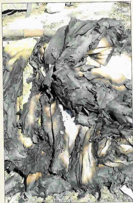
Пожар в июне 2020 года уничтожил все имущество «Текстиль Коми».

усилия, вся самостоятельность и надежды на будущее.