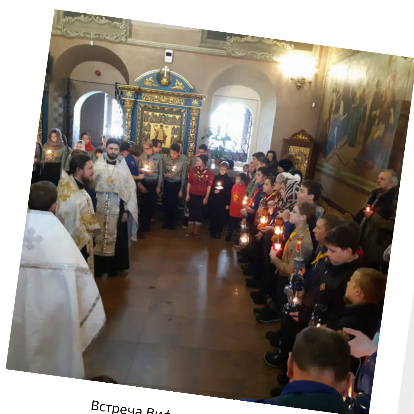
Встреча Вифлеемского огня скаутами Москвы и области