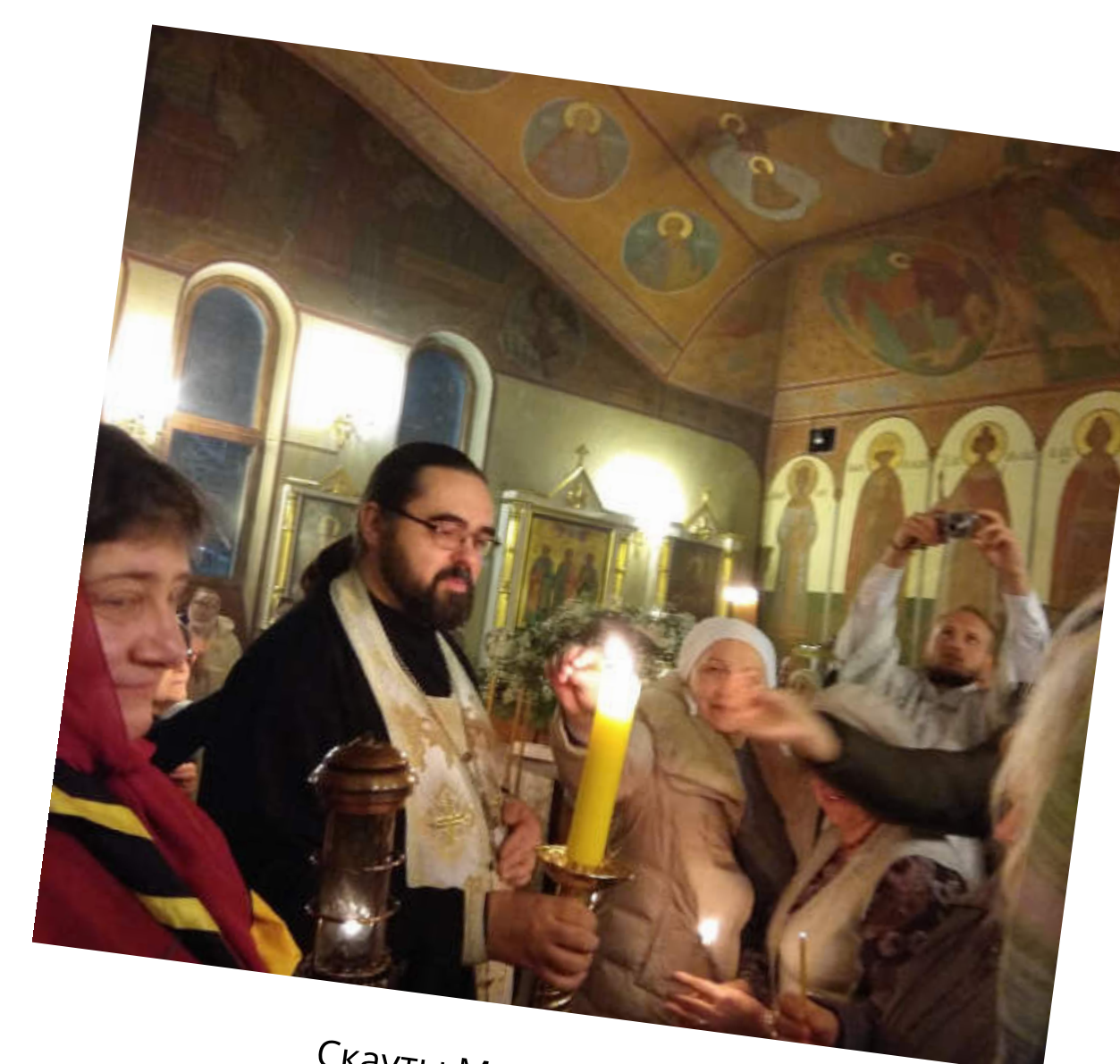
Скауты Москвы привезли благодатный огонь в храм на Поклонной горе