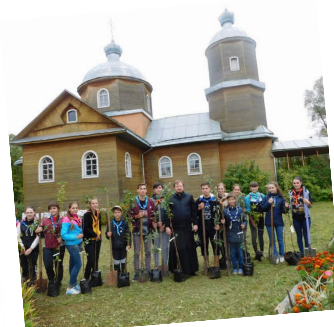
Отряд «Пегас», поселок Волот, Помощь в храме