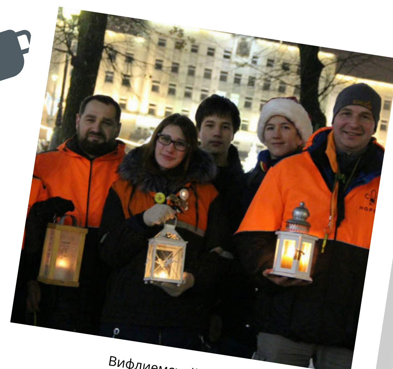
Вифлеемский огонь в Калининграде