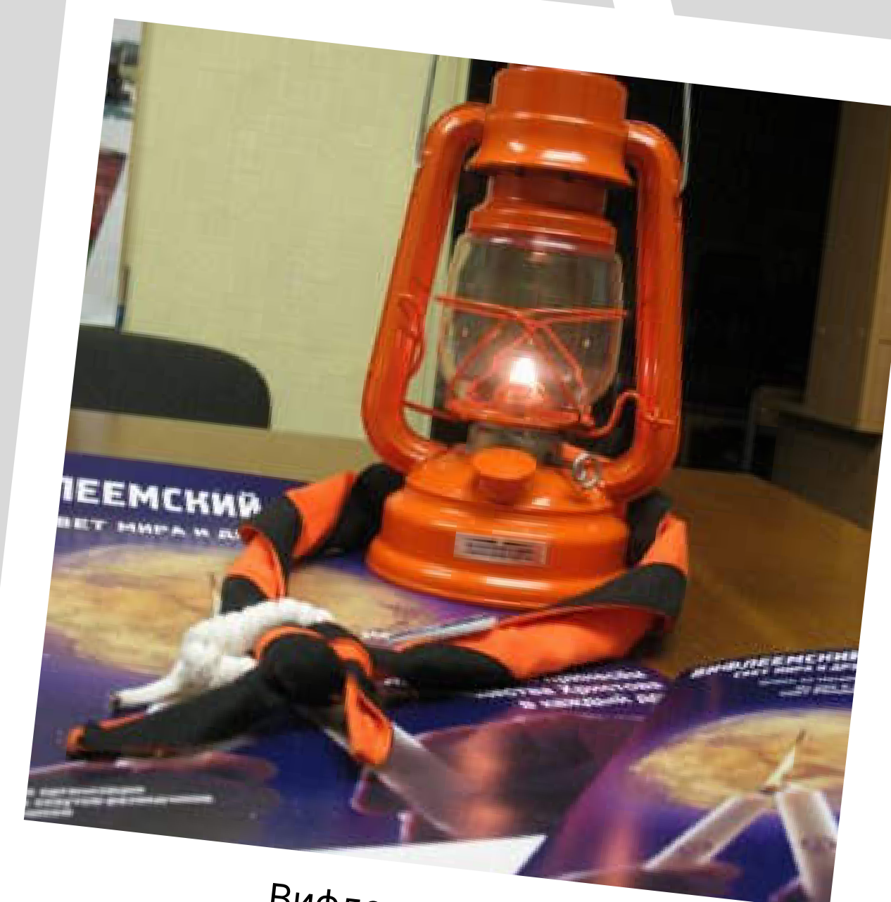
Вифлеемский огонь передается из рук в руки