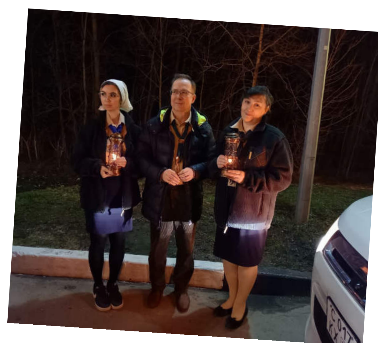
Скауты ОРЮР развозят Благодатный огонь в храмы Москвы