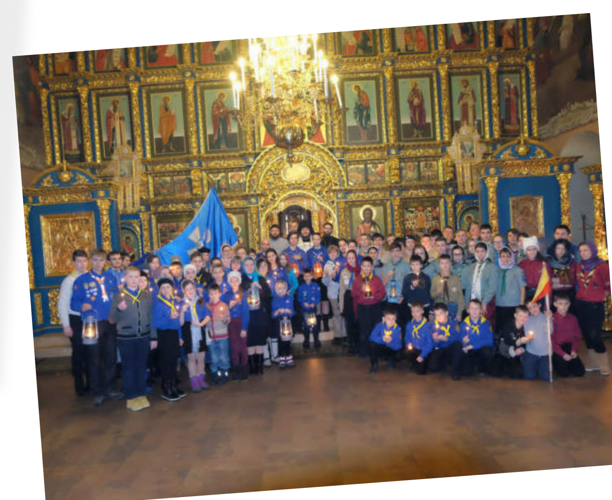
Крутицкое подворье, встреча Вифлеемского огня, Москва