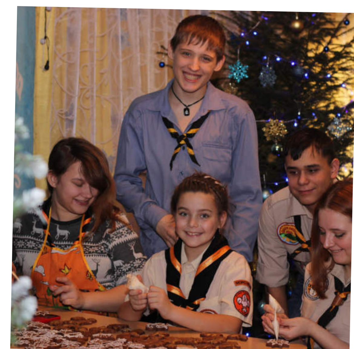
Рождественские козули, скауты Петровска