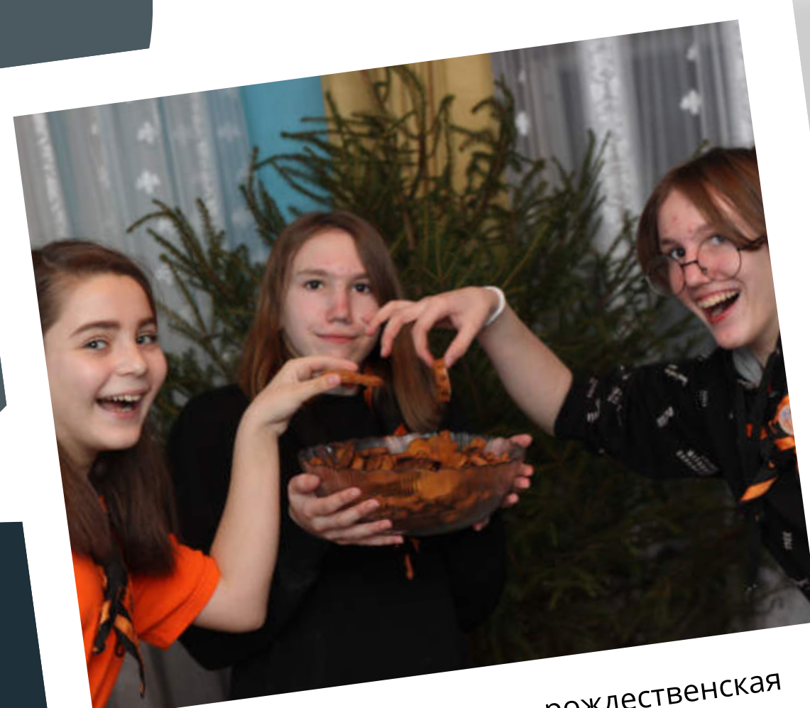
Печь поморские козули — рождественская традиция многих скаутов