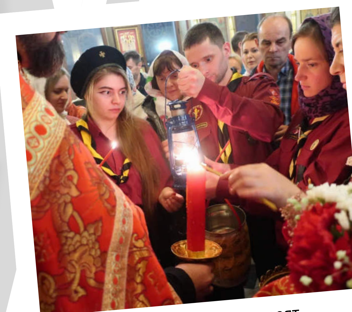
Скауты Москвы развозят Благодатный огонь