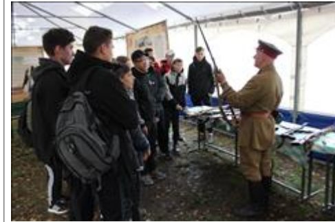
Подготовка и проведение итогового мероприятия в Омутнинске Проведение выставки на основе материалов и экспонатов музея «Плацдарм»