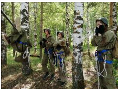
Проведение старта в Суне. Лето Туармейцы проходят этап "навесная переправа"