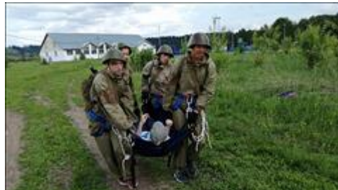
Проведение старта в Суне. Лето Этап дистанции по переноске ранненого