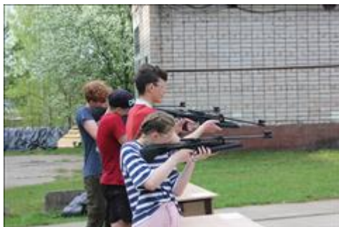
Проведение старта в Омутнинске. Лето Стрельба из пневматического оружия