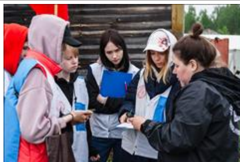
Организация работы с волонтерами и проведение судейского семинара Практические занятия при подготовке судейства дистанции

Мероприятие: Подготовка и проведение итогового мероприятия в Омутнинске