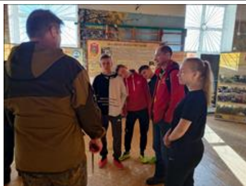
Проведение выставки в Суне Идет экскурсия