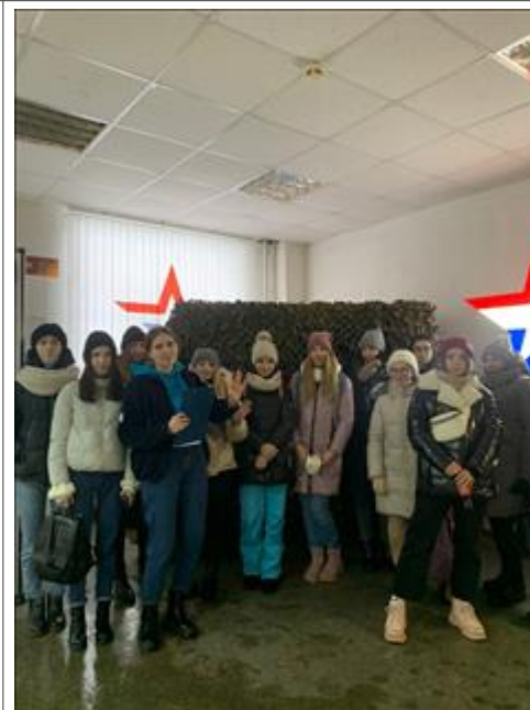
Организация работы с волонтерами и проведение судейского семинара Участники семинара в г.Кирове