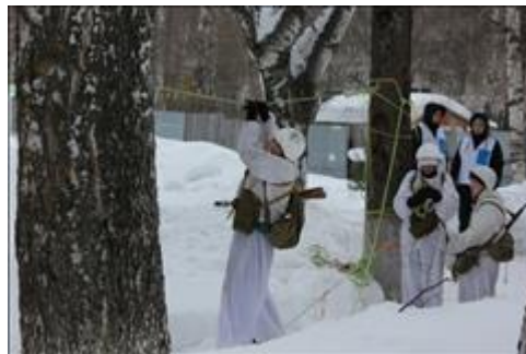
Проведение ТуАрминга в Омутнинске Команда проходит этап "Навесная переправа"