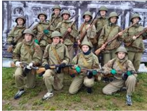
Проведение старта в Кирове. Лето Команды туармейцев перед стартом