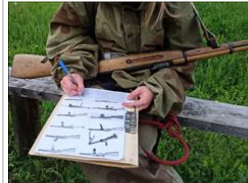
Проведение старта в Суне. Лето Туармеец проходит викторину по знанию стрелкового оружия