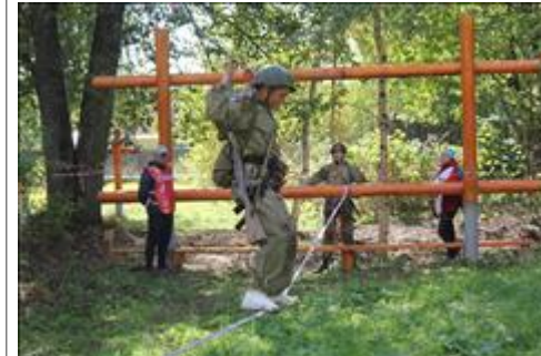
Подготовка и проведение итогового мероприятия в Омутнинске Прохождение этапа "Переправа по параллельным веревкам"