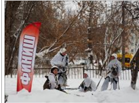
Проведение ТуАрминга в Кирове Команда закончила прохождение полевой дистанции