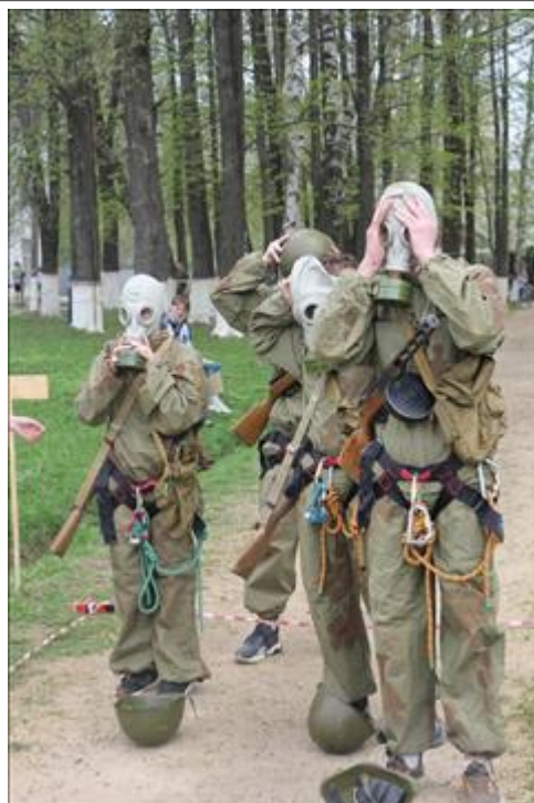
Проведение старта в Омутнинске. Лето Туармейцы на дистанции. Этап химической атаки