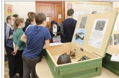
Проведение выставки в г.Омутнинске Молодые люди знакомятся с историей рейда 1 МВДБр