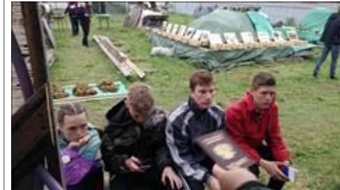
Проведение старта в Кирове. Лето. Прохождение комиссии по допуску