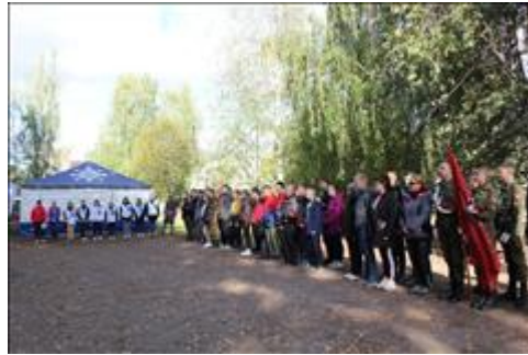
Подготовка и проведение итогового мероприятия в Омутнинске Построение на открытие