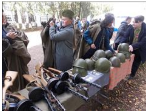
Подготовка и проведение итогового мероприятия в Омутнинске Интерактивная часть выставки. Проект "От Кремля до Рейхстага"