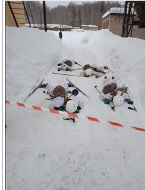
Проведение ТуАрминга в г.Кирове Команда проходит этап "Воздух"