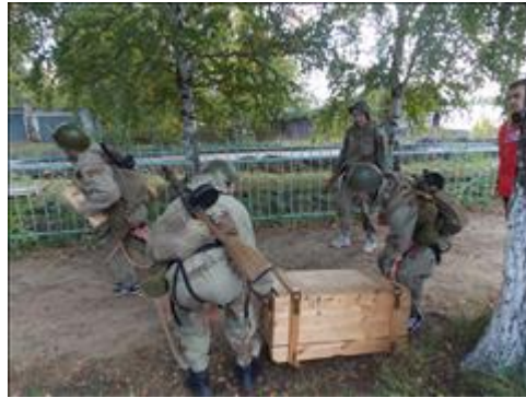
Подготовка и проведение итогового мероприятия в Омутнинске Этап "Переноска груза"