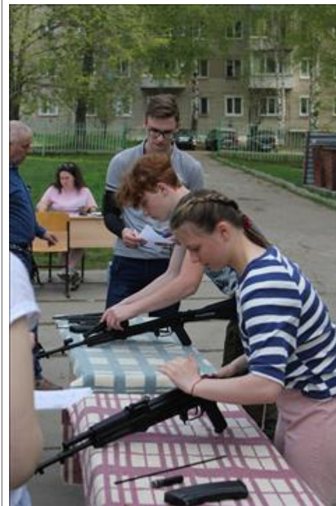
Проведение старта в Омутнинске. Лето Разбираем автомат