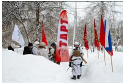
Проведение ТуАрминга в Кирове Стартовая зона полевой дистанции