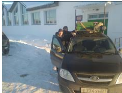
Проведение выставки в Суне Выставка приехала. Надо разгрузить и устанавливать