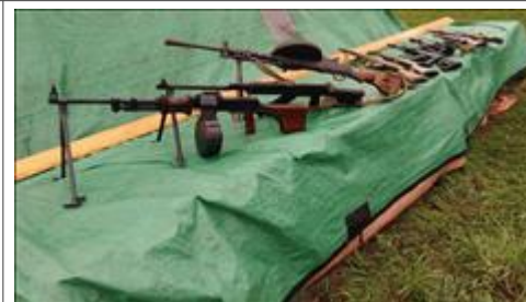
Проведение выставки в Кирове. Лето. Масмакеты оружия. Все можно трогать руками