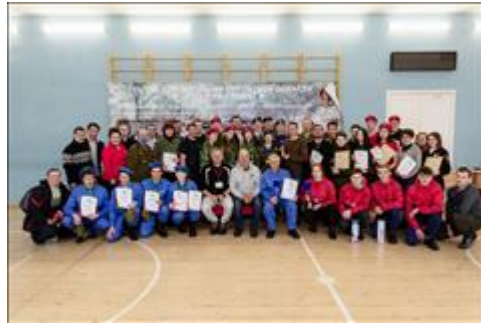
Проведение ТуАрминга в г.Кирове Совместное фото команд с главной судейской коллегией