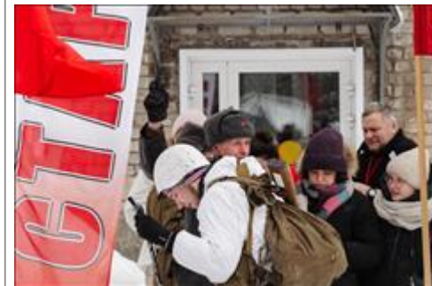
Проведение ТуАрминга в Кирове Выстрел из револьвера - сигнал к старту команды