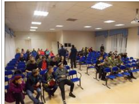
Подготовка и проведение итогового мероприятия в Омутнинске Проведение конкурса знаний о ВЕЛИКОЙ ОТЕЧЕСТВЕННОЙ ВОЙНЕ