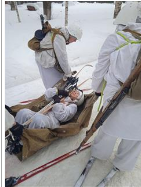
Проведение ТуАрминга в Омутнинске Команда проходит этап «Переноска раненого»