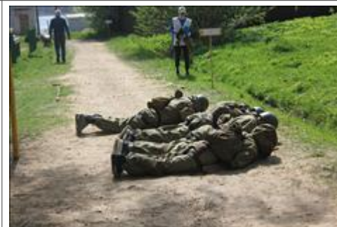
Проведение старта в Омутнинске Вспышка справа

Мероприятие: Организация работы с волонтерами и проведение судейского семинара