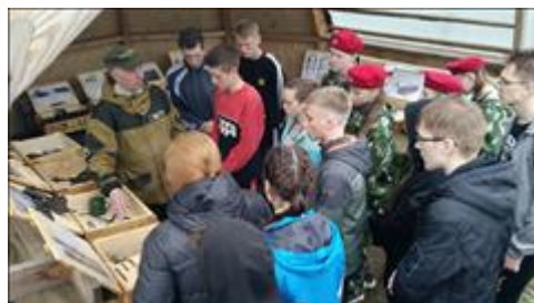
Проведение выставки в Кирове. Лето Команды получают свою долю правды