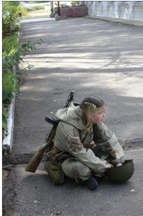
Подготовка и проведение итогового мероприятия в Омутнинске После финиша