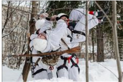
Проведение ТуАрминга в г.Кирове Прохождение этапа "Навесная переправа"