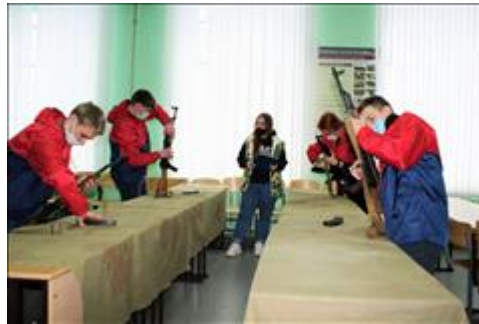
Проведение ТуАрминга в Кирове Этап сборки-разборки автомата