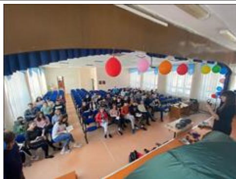
Подготовка и проведение итогового мероприятия в Омутнинске Семинар в Омутнинске