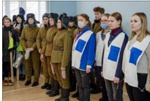
Проведение ТуАрминга в Кирове Добровольцы соревнований