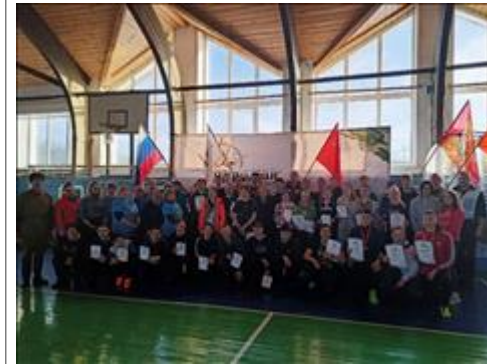
Проведение ТуАрминга в Суне Общее фото после награждения