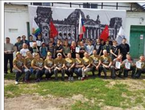
Проведение старта в Суне. Лето Старт закончен.