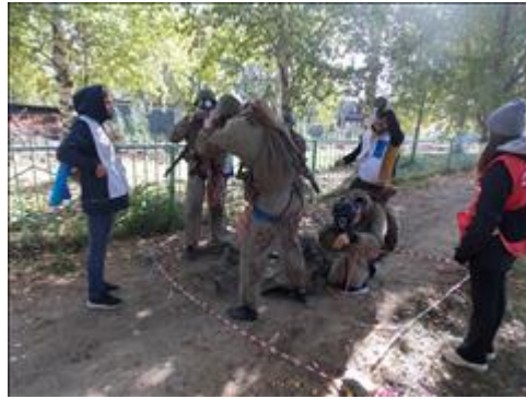
Подготовка и проведение итогового мероприятия в Омутнинске Этап "Работа с пострадавшим"