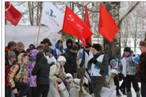
Проведение ТуАрминга в Омутнинске Мы все делаем одно дело

Мероприятие: Проведение выездной выставки на основе материалов и экспонатов музея «Плацдарм» посвященной