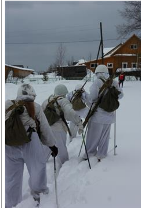
Проведение ТуАрминга в Омутнинске Команда проходит этап "Тропление лыжни"