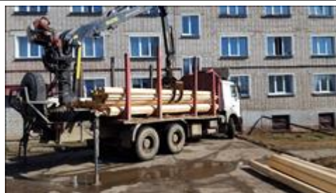
Строительство полигона Привезли бревна

Мероприятие: Оборудование модельной площадки для проведения соревнований по ТуАрмингу в Омутнинске.