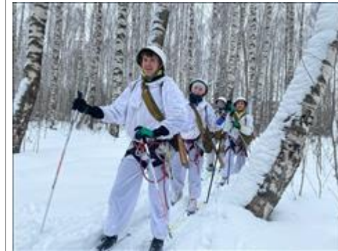
Проведение ТуАрминга в г.Кирове Команда на лыжной дистанции