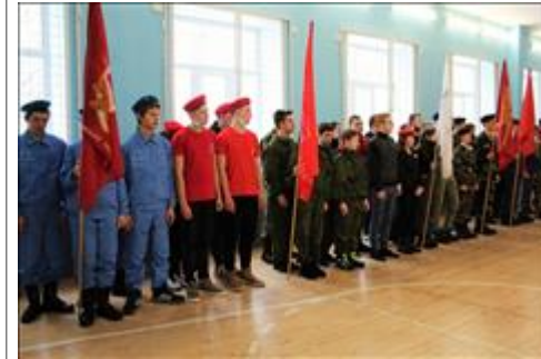
Проведение ТуАрминга в Кирове Построение команд на закрытии соревнований