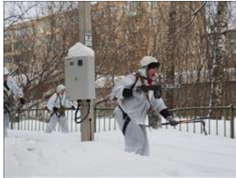
Проведение ТуАрминга в г.Кирове Команда проходит этап "Атака"