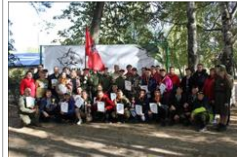
Подготовка и проведение итогового мероприятия в Омутнинске Все! Закончили!

Мероприятие: Оборудование модельной площадки для проведения соревнований по ТуАрмингу в Омутнинске.