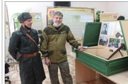
Проведение выставки в г.Омутник В мирных руках и штык может быть указкой