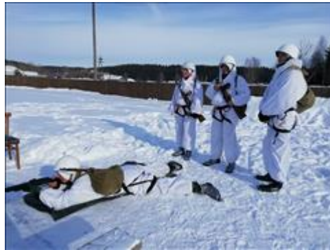
Проведение ТуАрминга в Суне Прохождение командами этапа "снайпер"