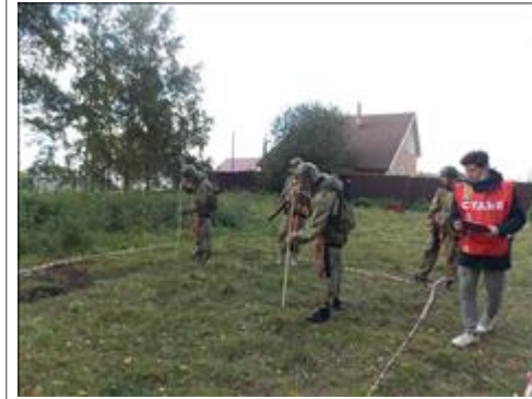
Подготовка и проведение итогового мероприятия в Омутнинске Этап "Мины"