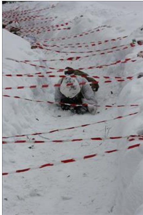
Проведение ТуАрминга в Омутнинске Команда проходит этап "Переползание"