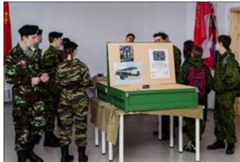
Проведение выставки "Плацдарм" г.Киров Члены команд ТуАрмингана этапе "Выставка"

лыжному рейду десантников 1 маневренной воздушно-десантной бригады, и 36 стрелковой бригаде, сформированным в Кировской области в 3 муниципальных образованиях Кировской области