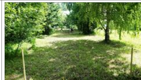
Возведение полигона Планирование площадки