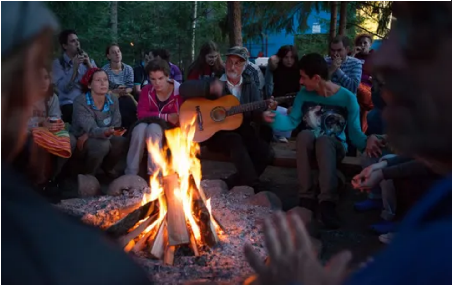
Интегративный летний лагерь «Лесная Сказка». Валдай, 2018 год