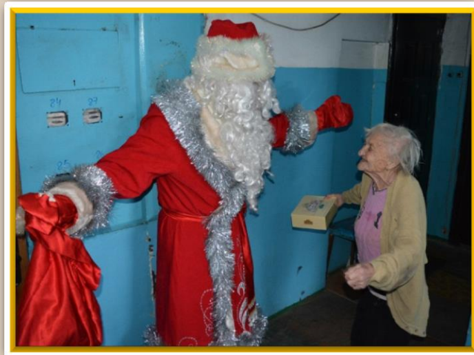
Новогодняя акция «Волшебный праздник Новый Год»

Ежегодные акции проводятся под эгидой Поронайской Местной общественной организации пенсионеров, а главными помощниками выступают волонтеры культуры.