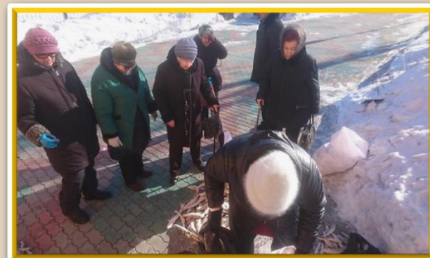
Акция «Ловись, рыбка!»

Ежегодные акции проводятся под эгидой Поронайской Местной общественной организации пенсионеров, а главными помощниками выступают волонтеры культуры.