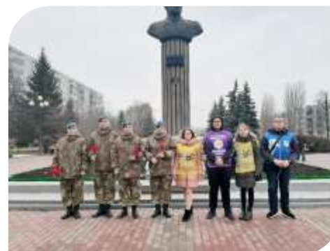
«День героев отечества»