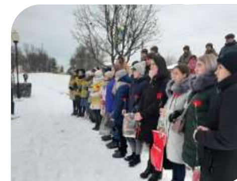
«День неизвестного солдата»