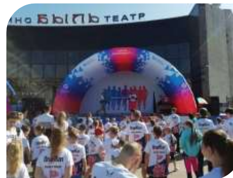
«Все на спорт»