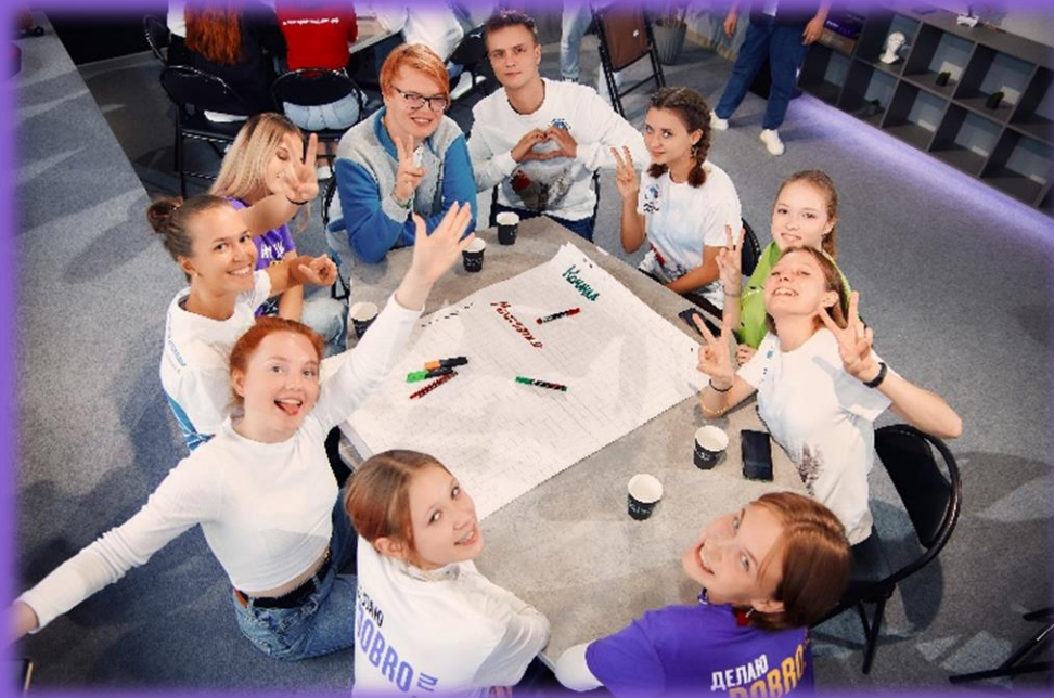
OPEN SPACE СОЦИАЛЬНОЕ ПРОЕКТИРОВАНИЕ