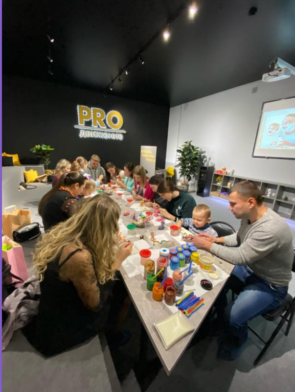
КЛУБ МОЛОДОЙ СЕМЬИ