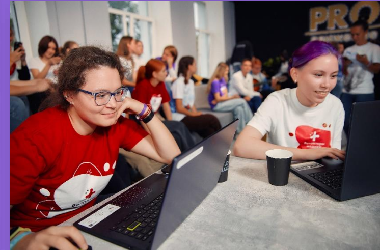
WORLD CAFÉ ОБРАЗОВАТЕЛЬНЫЕ ПЛОЩАДКИ