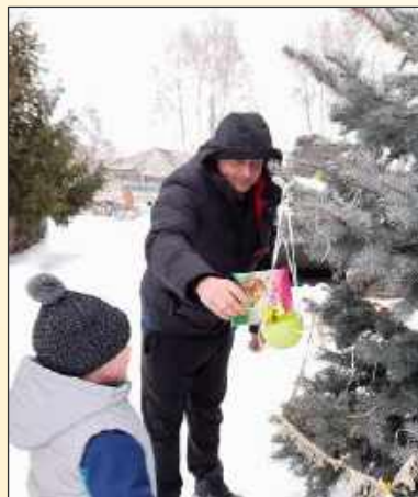
Акция «Покормите птиц зимой»