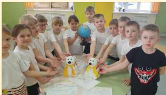
Акция «Спасем белых медведей»