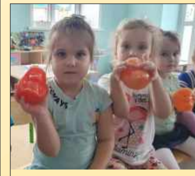
Акция «День леса» Флешмоб «Голубая лента» Акция «День воды» Акция «Сдал батарейку-спас ёжика»

*Указ Президента Российской Федерации от 21.07.2020 № 474