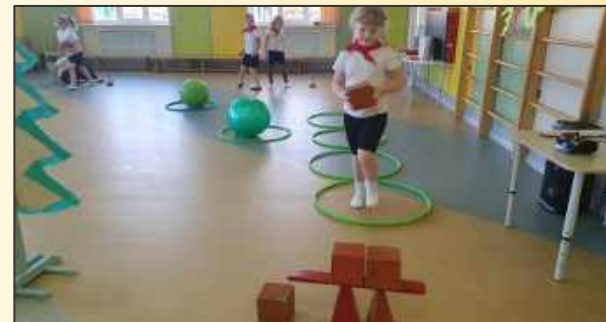
Занятие пешим туризмом «Тропа здоровья»