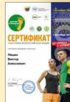
Команда родителей и детей «Вздорбярчѣк»