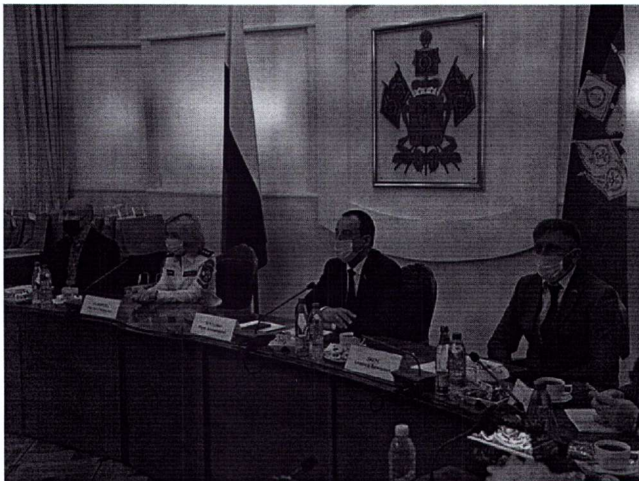
ПРЕДСЕДАТЕЛЬ ЗСК ЮРИЙ БУРЛАЧКО (ТРЕТИЙ СЛЕВА) И ГЛАВА РОСПРИРОДНАДЗОРА СВЕТАНА РАДИОНОВА НА ВРУЧЕНИИ ПРЕМИИ «ЭКОЛОГИЯ – ДЕЛО КАЖДОГО» В КРАСНОДАРЕ