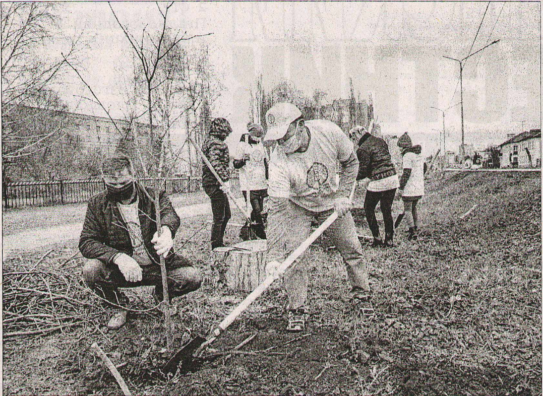
Весной в районе посадили 352 крупномера, 490 саженцев и кустарников.