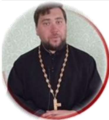
Протоиерей Игорь Бродяной