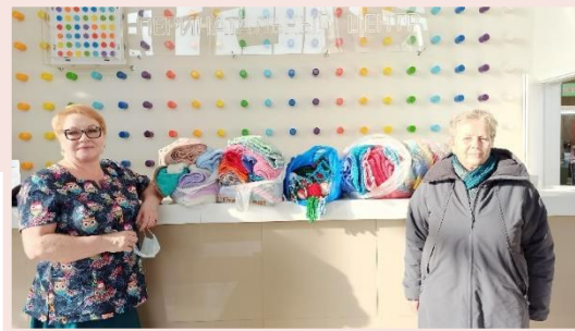
КГБУЗ «Красноярский краевой клинический центр охраны материнства и детства» (г. Красноярск)