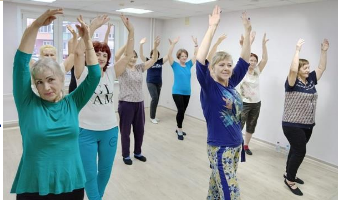
Танцевальные занятия «Трайбл»