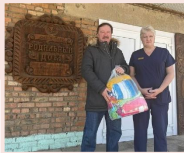
Родильное отделение КГБУЗ «Канская межрайонная больница»