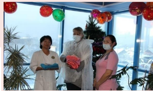
ГБУЗ Республики Тыва "Перинатальный центр Республики Тыва