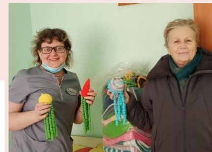
КГБУЗ «Красноярский межрайонный родильный дом №4», г. Красноярск