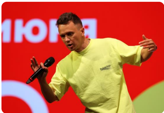
Молодежный форум «Бизнес-уикенд»