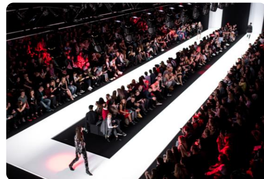
Moscow Fashion week