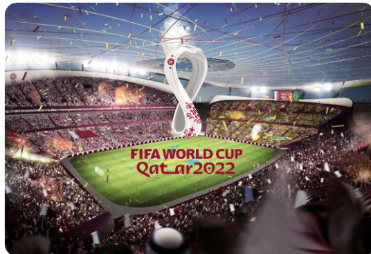
ЧМ2022 по футболу