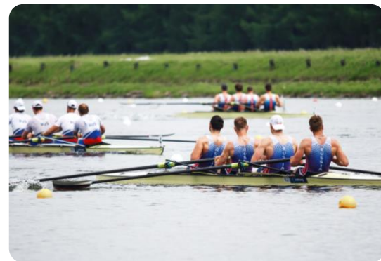
Большая московская регата