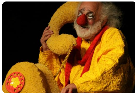
«Снежное шоу» Славы Полунина