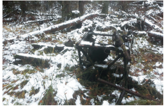
Фрагменты и место падения самолета, 2018 год

искореженным авиационным металлом. Воронки от падения не было. От самой боевой машины сохранились моторама, фрагменты центроплана, лонжероны. Рядом был обнаружен фрагмент расколотой бронеспинки. Продолжая работу, поисковиками были найдены пряжки подвесной системы парашюта и вытяжное кольцо. Это указывало нам на то, что с большей долей вероятности останки летчика находятся рядом. Было принято решение провести работу по очистке места падения самолета от металла и начать перекапывать и просеивать грунт в поисках останков летчика. К этому нас подтолкнул аналогичный опыт работы на других местах гибели экипажей. В первые ноябрьские экспедиции территория была расчищена от основного скопления обломков самолета. Но работы были приостановлены зимним периодом.