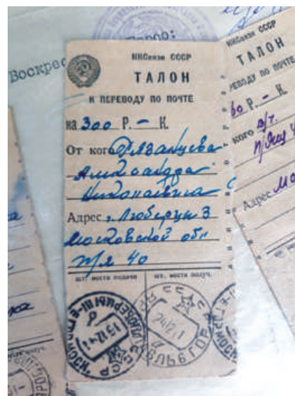
Талон к переводу по почте денег жене. 19.12.1941 г.