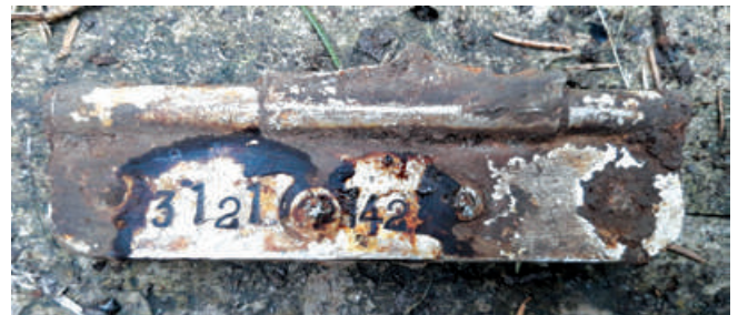
Петля с номером самолета ЛаГГ-3 31211422

В канун великого праздника Победы, 4 мая 2019 года мы продолжили наши поиски. Результат не заставил долго ждать. Нами были обнаружены обгорелые фрагментированные костные человеческие останки, наушник шлемофона, фрагменты парашютной системы, а также ботинок погибшего летчика.