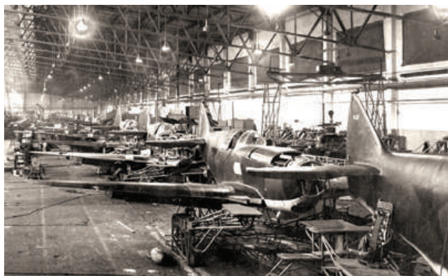
Сборка самолетов ЛаГГ-3 на авиационном заводе № 21

Вечная память нашим авиаторам-защитникам неба Родины! Поиск продолжается!