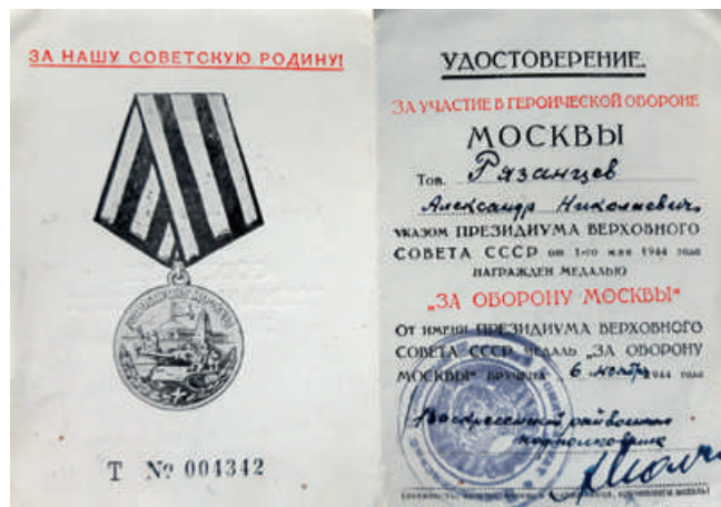
Удостоверение к медали За оборону Москвы