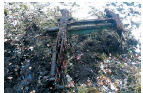
Фрагменты центроплана самолета