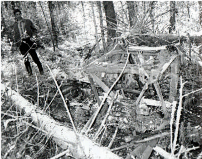
Фрагменты и место падения самолета, 2004 год