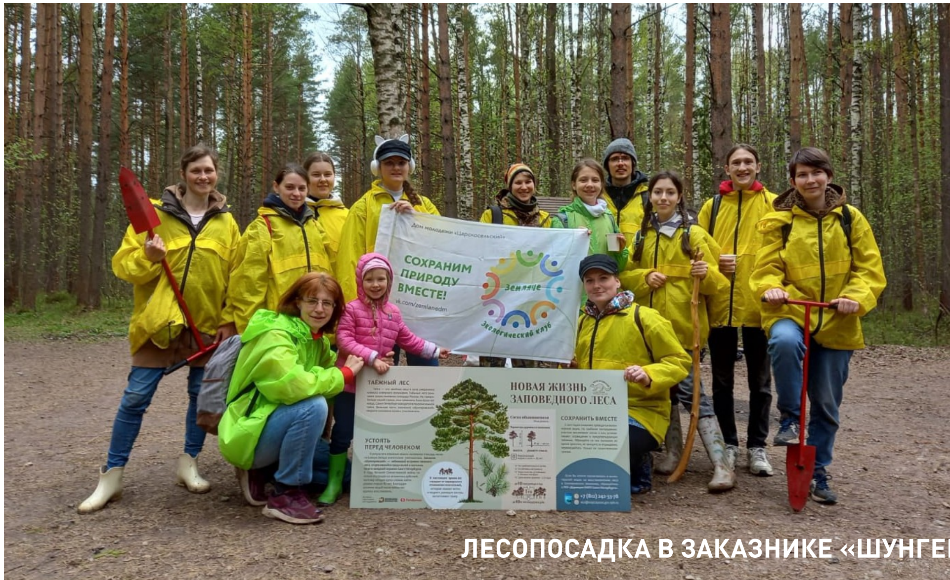
ЛЕСОПОСАДКА В ЗАКАЗНИКЕ «ШУНГЕРОВСКИЙ»