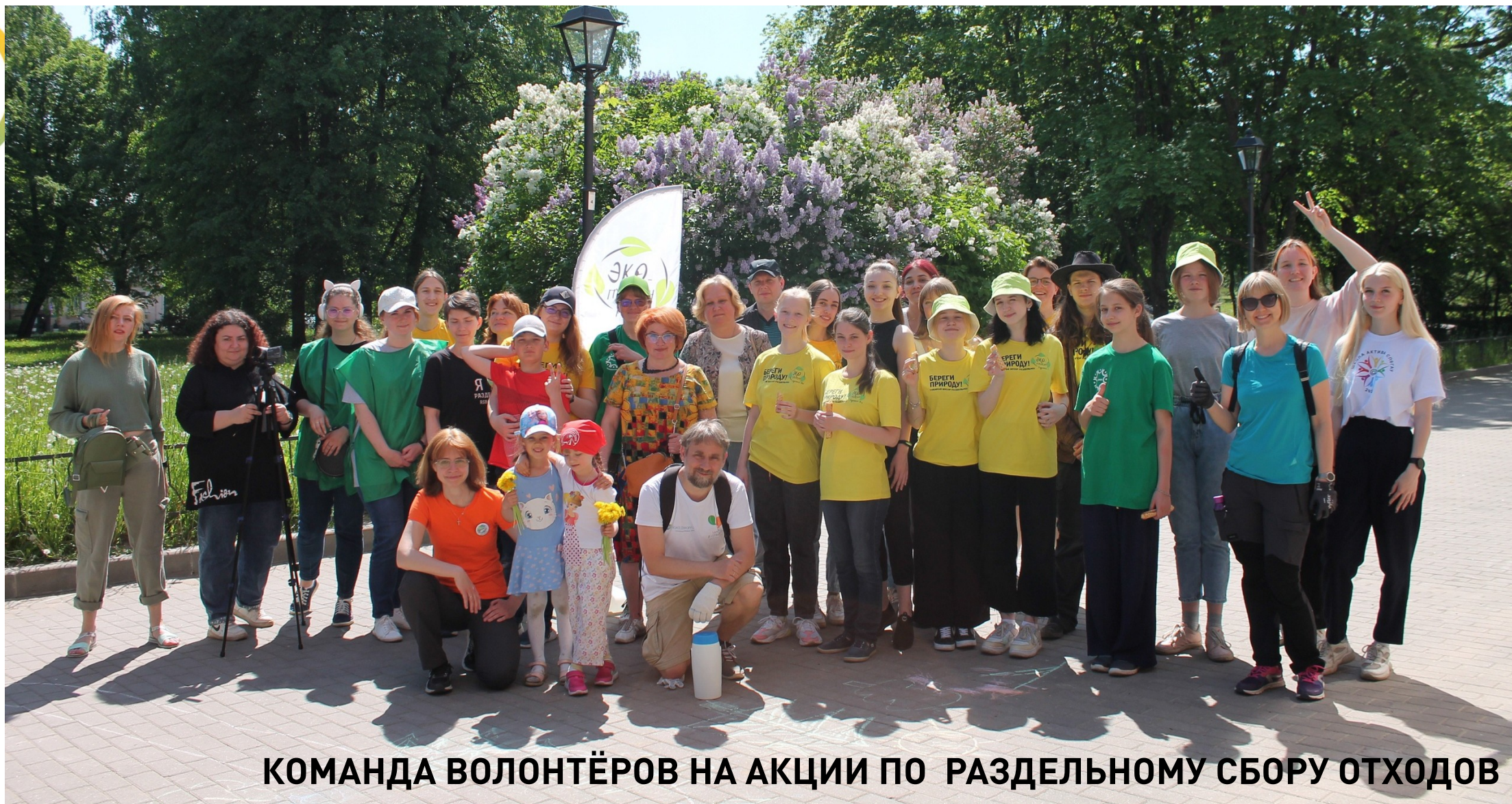
КОМАНДА ВОЛОНТЁРОВ НА АКЦИИ ПО РАЗДЕЛЬНОМУ СБОРУ ОТХОДОВ