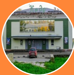
Площадка у кинотеатра «Кедр»