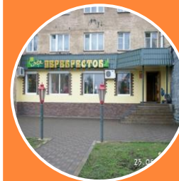
Пешеходная дорожка по ул.Воронова (ближе к кафе «Перекресток»)