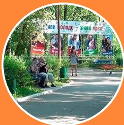
Парк им. Ю.А.Гагарина