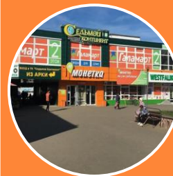
Площадка у ТЦ «Седьмой континент»