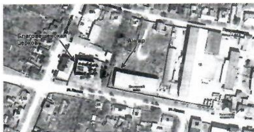
Рис 3. Карта расположения здания и Благовещенского храма

3. При выборе художественного решения нужно учитывать расположение здания, непосредственно примыкающего к Благовещенскому храму (см. приложение 4 «Историческая справка»)