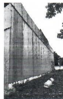
Рис 2. Фотография поверхности для нанесения изображения