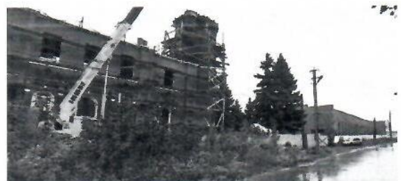
Рис 4. Фотография расположения здания и Благовещенского храма