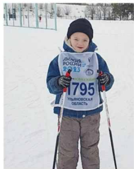
Будущий кадет и чемпион

200 метров, а в лыжной гонке по линии казачества прибежал первым на дистанции 500 м. Молодец!