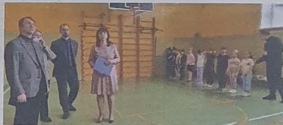
В спортзале и одном из классов Троицкосунгурской казачьей средней школы

Согласно национальным целям развития страны, Президент Владимир Путин поставил задачу к 2030 году сделать спорт нормой жизни для 70% россиян. Для этого мы продолжим создавать условия, обеспечивающие гражданам возможность систематически заниматься физической культурой и спортом, а также подготовку спортсменов высокого класса. Мы видим, что ежегодно увеличивается число жителей, которые занимаются спортом, это связано с активизацией пропаганды здорового образа жизни и привлечением жителей всех возрастов к участию во всероссийских массовых соревнованиях, - отмечает Губернатор Ульяновской области Алексей Русских.