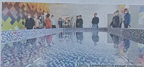
Здесь занимаются юные пловцы