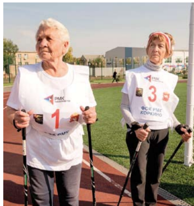
Члены Клуба 80+ занимаются скандинавской ходьбой

Вот так в жизни ветеранов, посетивших мероприятие Общества «Знание», появилось новое увлечение.