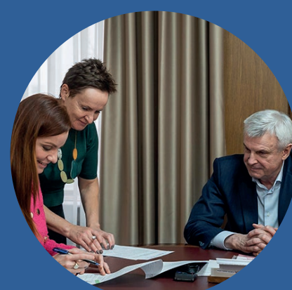
Сергей Носов Губернатор Магаданской области