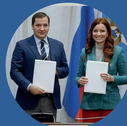
Александр Цыбульский Губернатор Архангельской области