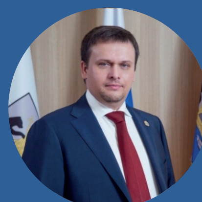
Андрей Никитин Губернатор Новгородской области