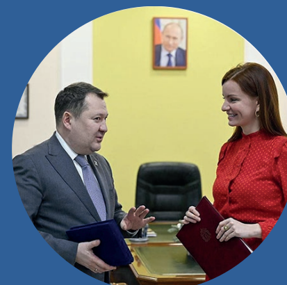
Максим Егоров Губернатор Тамбовской области