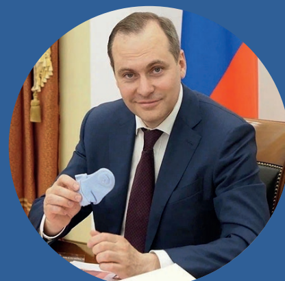
Здунув Артём Глава Республики Мордовия