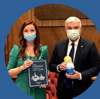
Владимир Уйба Глава Республики Коми