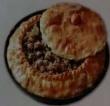
1. Башкирская кухня. Балеш

Карточки предназначены для лиц с нарушением зрения, которые можно изучить на ощупь. Если игру с рельефными карточками проводить с лицами без патологии зрения, закрывая им глаза повязкой, то данная группа имеет возможность приобрести опыт получения информации через тактильные ощущения и лучше начинает понимать лиц с нарушением зрения.