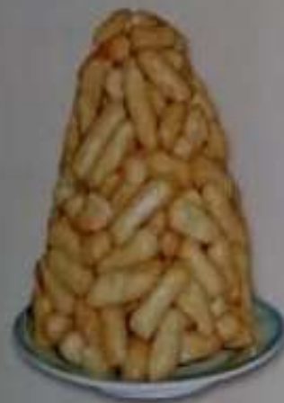
17. Татарская кухня. Чак-чак