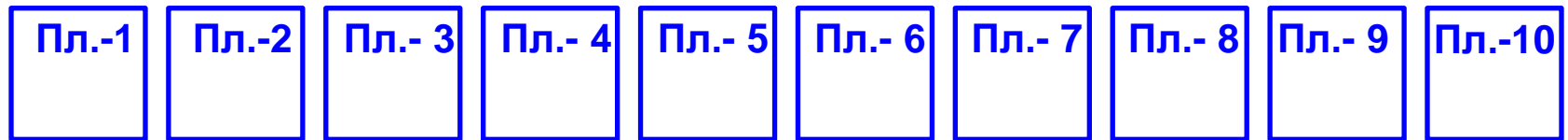
Планы работ проектно-аналитических команд

В команде «Коуч-тьютор» должно быть число людей, равное числу проектно-аналитических команд + 2 чел.