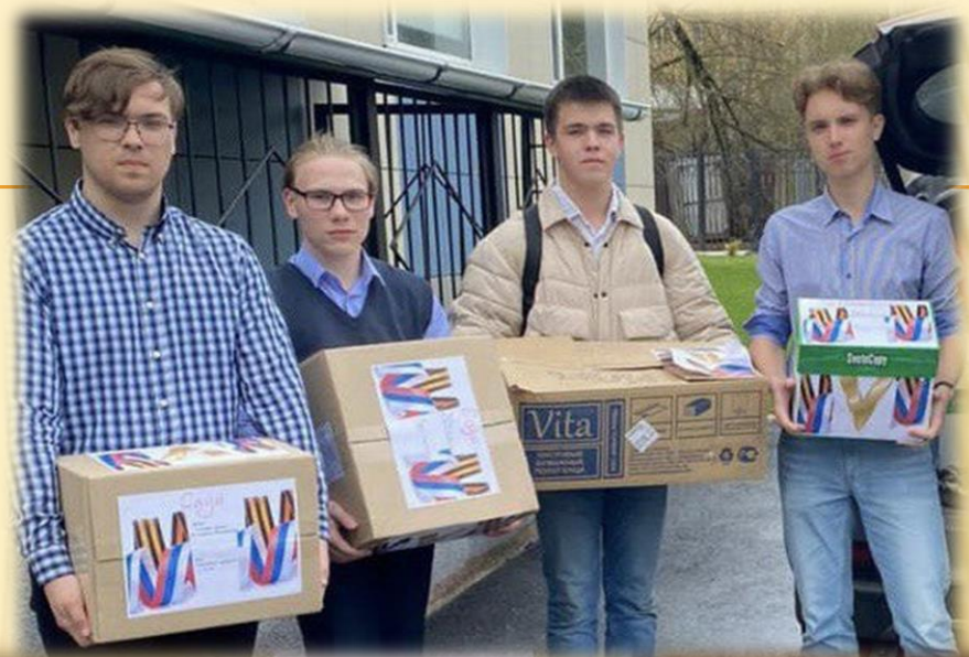
Акция «Открытые сердца» (сбор гуманитарной помощи)