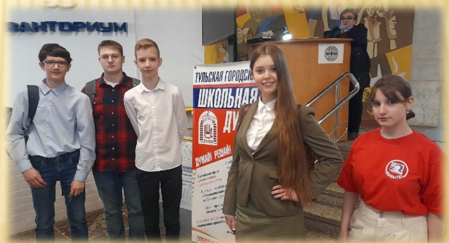
Студия «Лицей Видео», одним из последних достижений которой стала победа в организационно-деятельностной игре «ТОП-инфо».