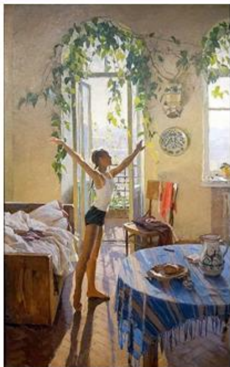
Татьяна Яблонская «Утро»