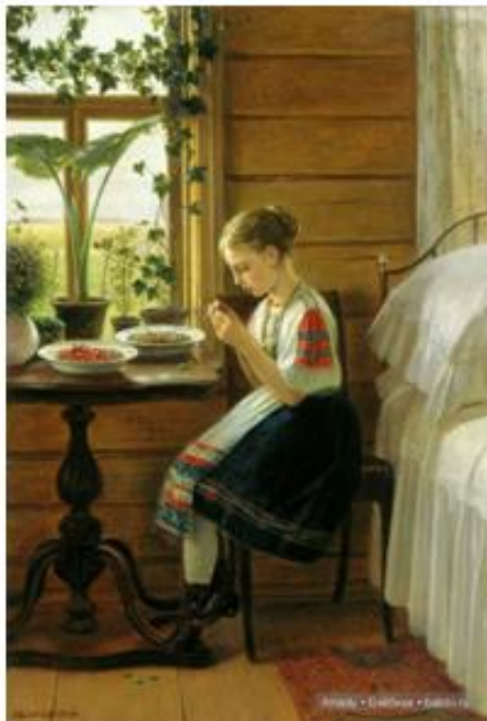
Николай Быковский «На даче»