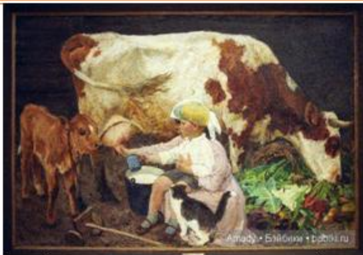
Аркадий Пластов «Кружка молока»