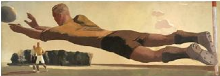
Александр Дейнека «Вратарь»