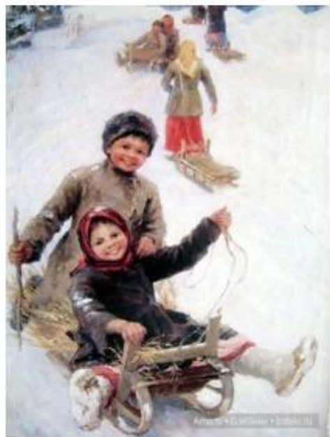
Федот Сычков «Катание с горы»