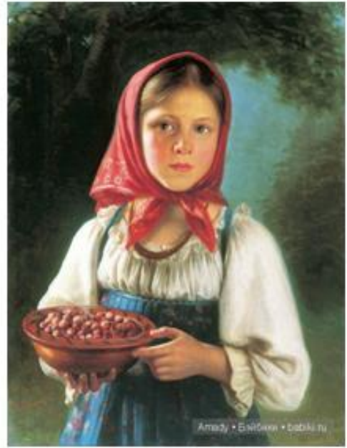
Василий Тимофеев «Девочка с ягодами»