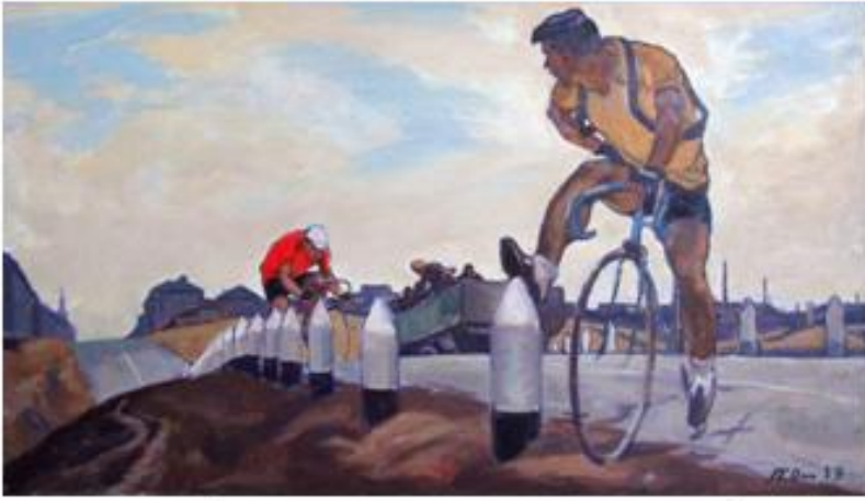
Пётр Оссовский «На окраине города»