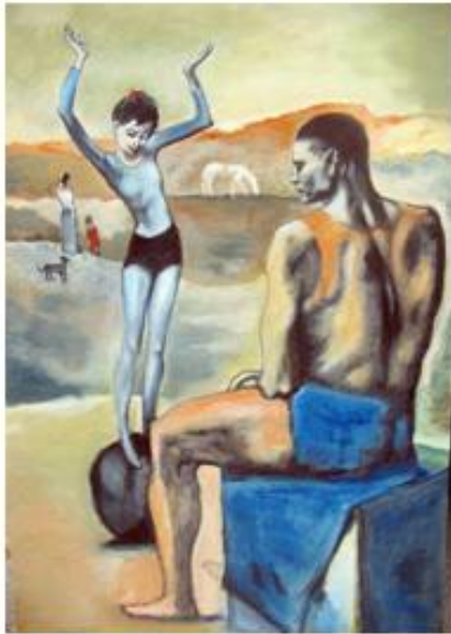
Пабло Пикассо «Девочка на шаре»