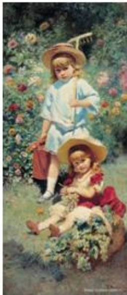
Константин Маковский «Портрет детей художника»