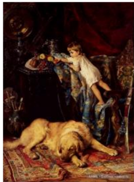
Константин Маковский «В мастерской»