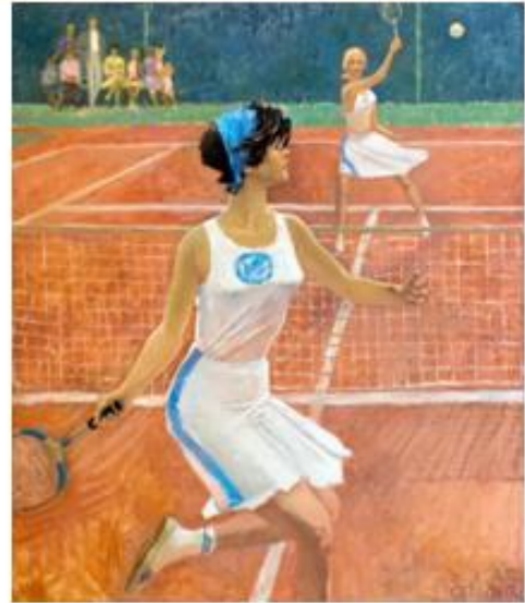
Александр Самохвалов «Теннис»