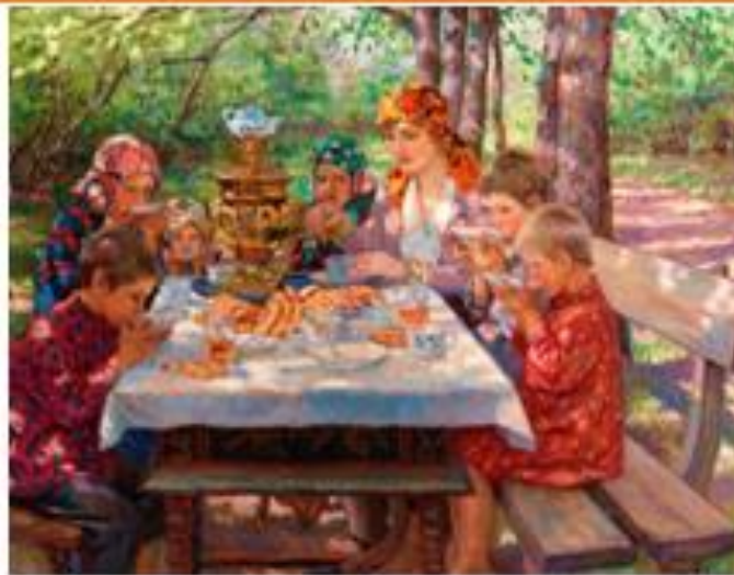
Николай Богданов-Бельский «Чаепитие у самовара»