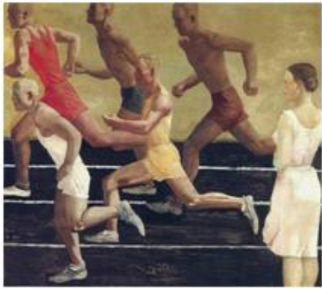
Александр Дейнека «Бегуны»