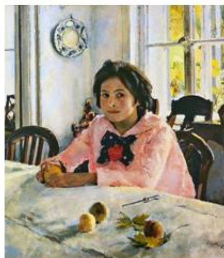
Валентин Серов «Девочка с персиками»