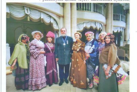
Фото Лианы архив Любови Коляменковой, автор неизвестен

Спектакль «На карнавале как-то раз...» поставлен на реальных историях дореволюционной Тюмени