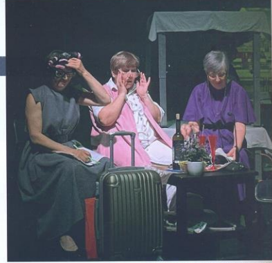
Сцена из спектакля «Три сестры!»